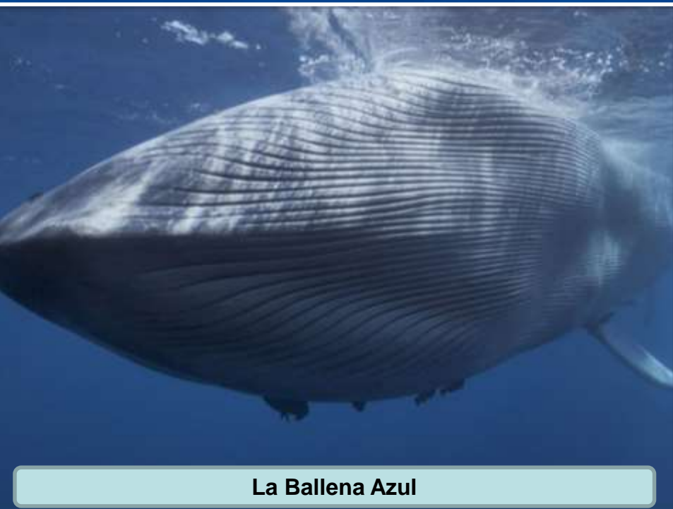
La Ballena Azul