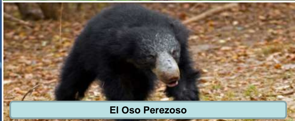
El Oso Perezoso