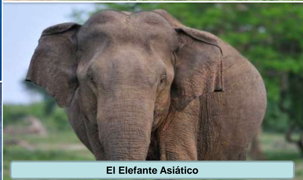
El Elefante Asiático