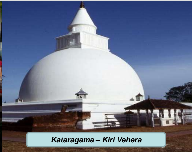
Kataragama – Kiri Vehera