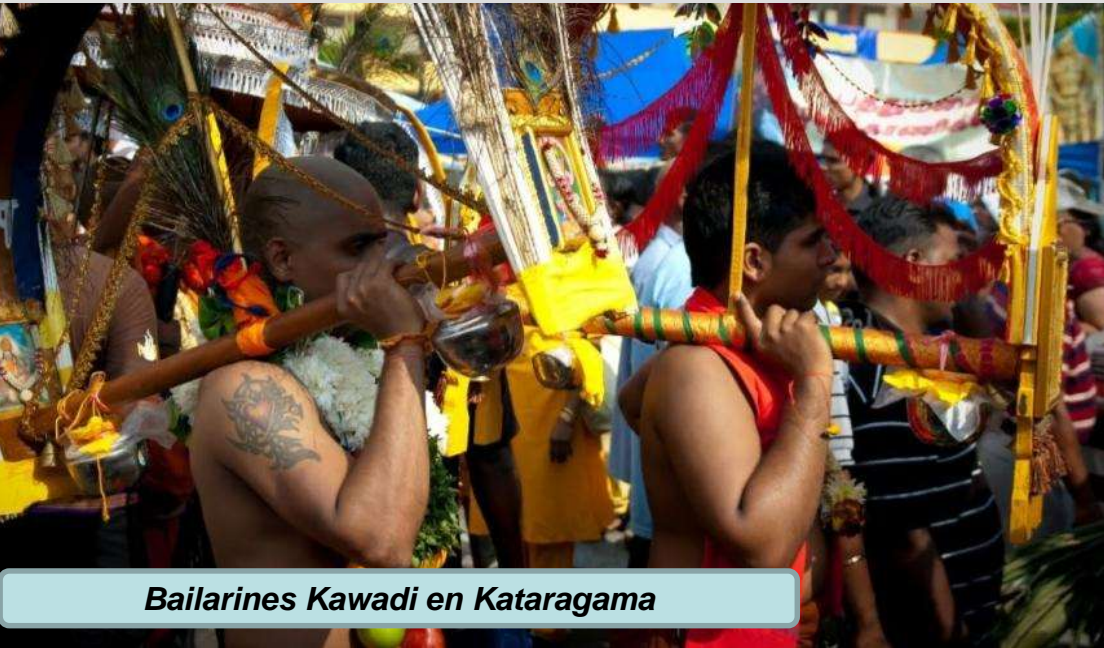
Bailarines Kawadi en Kataragama