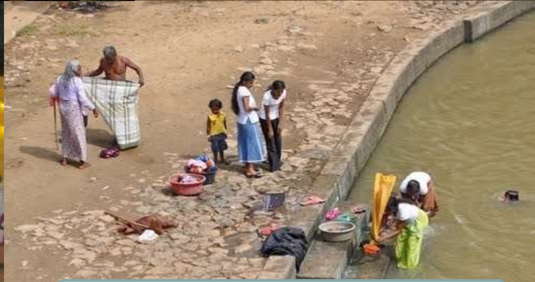
Abluciones de peregrinos en el Río Menik Ganga