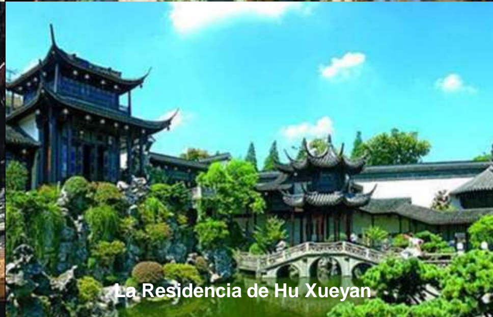
La Residencia de Hu Xueyan