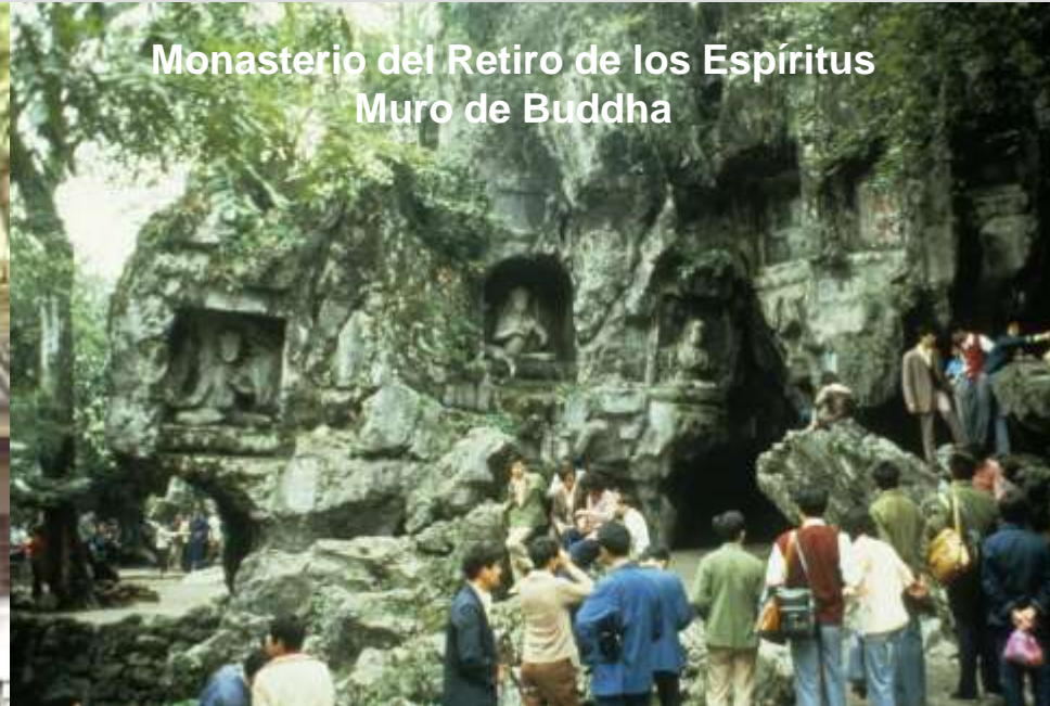
Monasterio del Retiro de los Espíritus Muro de Buddha