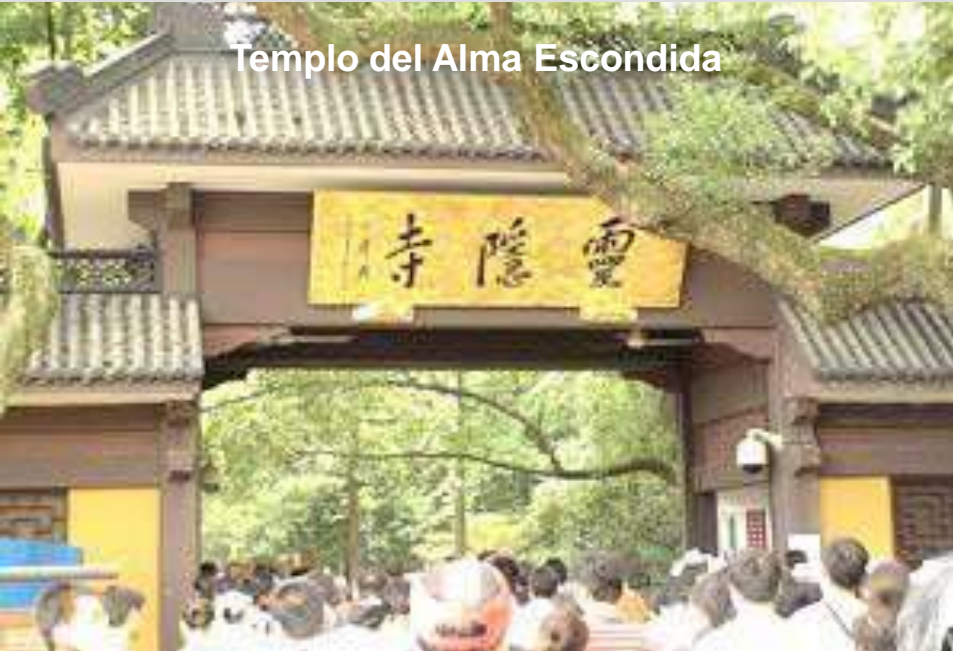
Templo del Alma Escondida