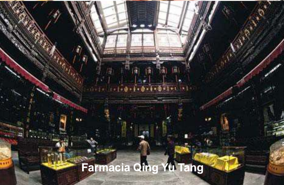
Farmacia Qing Yu Tang