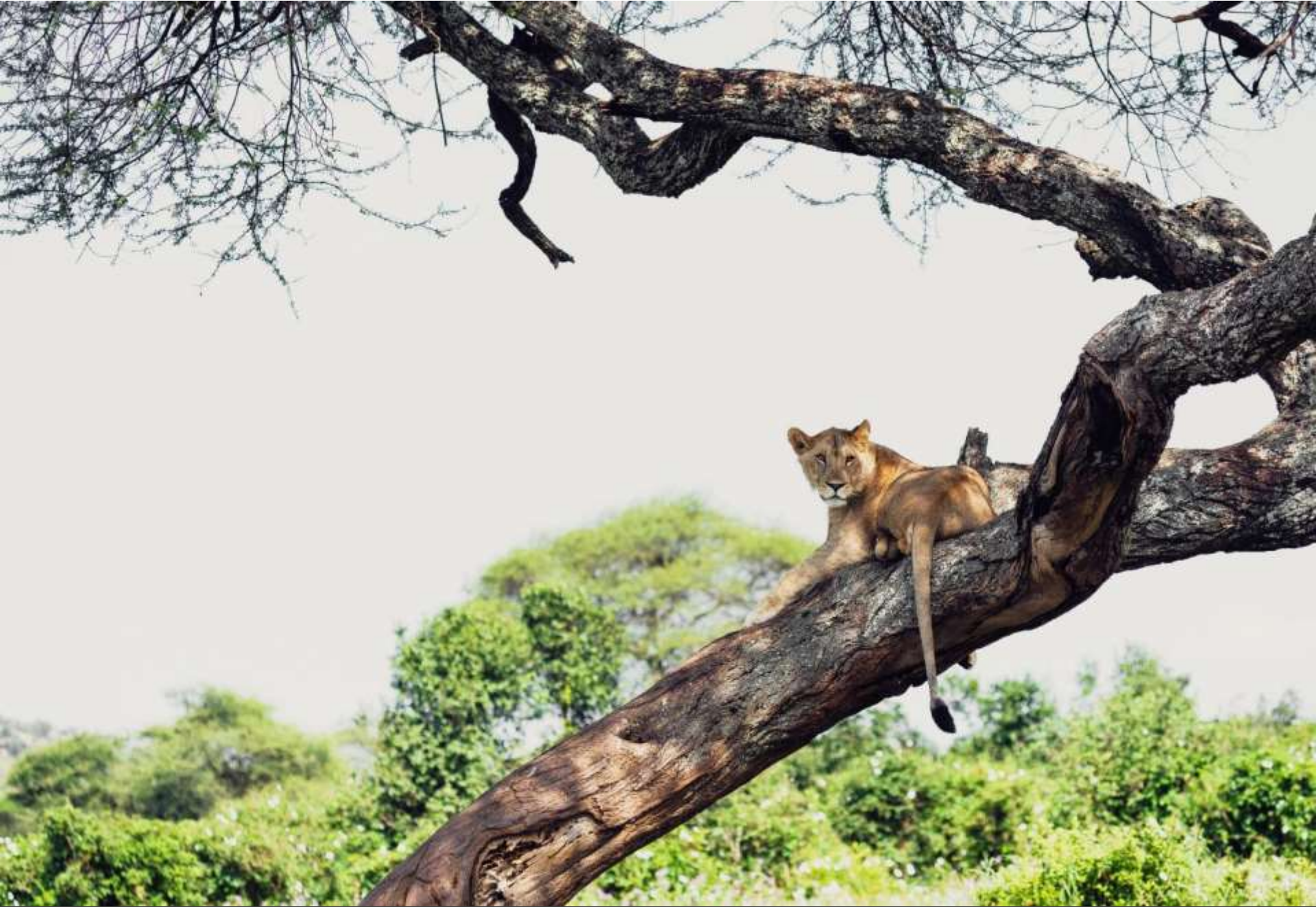
Sanctuary Swala – PN Tarangire - Tanzania