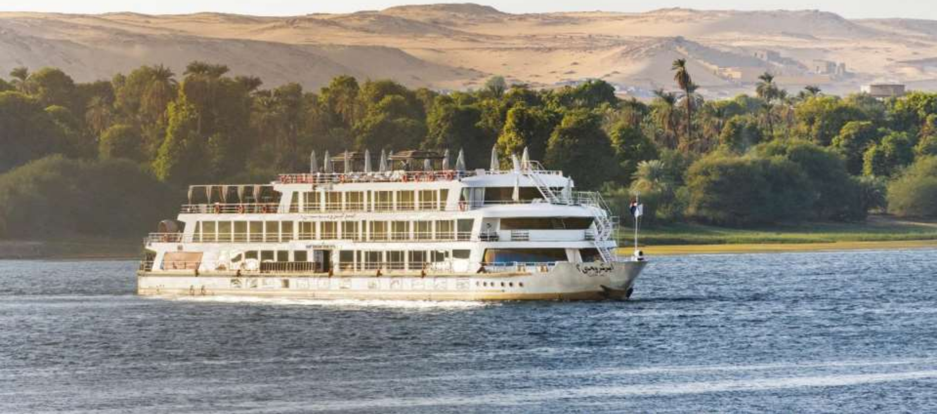
Sanctuary Sun Boat IV, Egipto