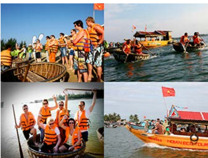
Hoi An Carrera Barcas de Cesta