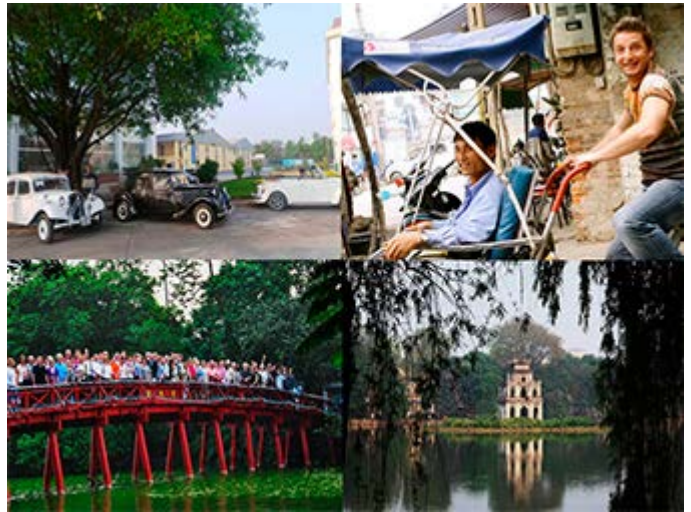
Visite Hanoi en Coches de Época o Ciclos