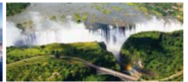
Zimbabue y Zambia