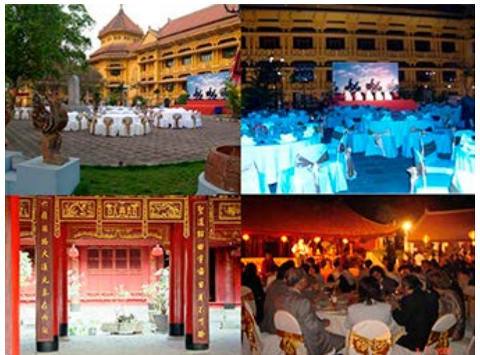
Hanoi Cena en el Museo Historico