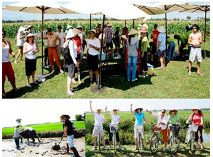
Hoi An Actividad Team Building - El hombre y la fuerza