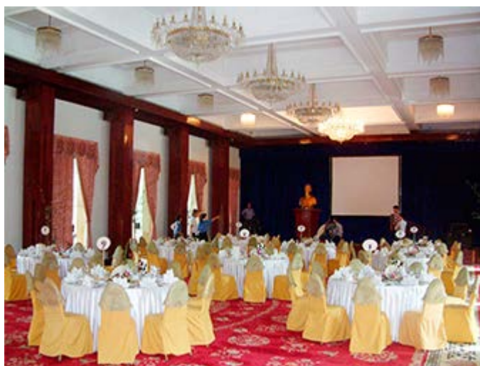
Ho Chi Minh Cena en el Palacio de la Reunificación

Para reservar o solicitar una cotización de tu viaje a medida o de nuestros itinerarios, contacta con: