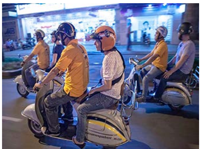
Ho Chi Minh Tour en Vespa al estilo local