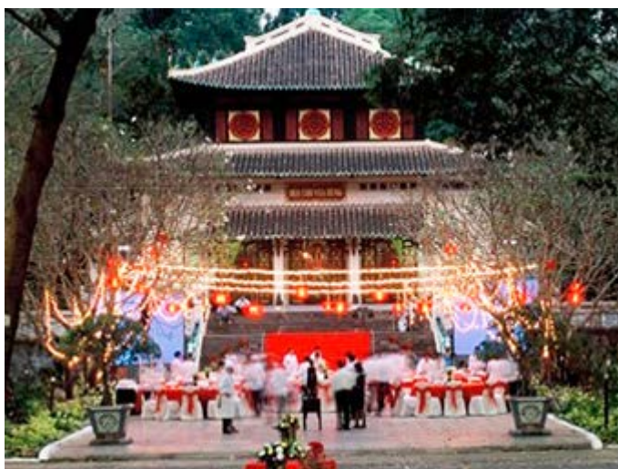
Ho Chi Minh Cena en el Jardín Botánico