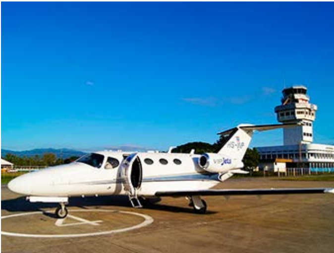
Itinerarios en Jet Privado - Lo Mejor de lo Mejor

Te ofrecemos auténticas y estimulantes experiencias para que tu viaje sea increíble, emocionante, intrigante, rejuvenecedor y memorable. Actividades para profundizar, entender o interactuar con la verdadera cultura del lugar que está visitando. Algunas experiencias son de acceso exclusivo y privilegiado y representan toda una nueva experiencia para el viajero. Nuestro objetivo es satisfacer y superar las expectativas de tus clientes