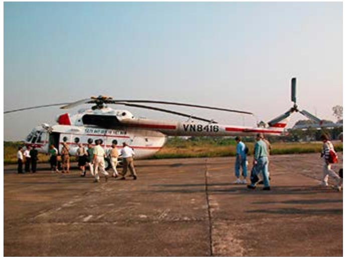
Vuelo en Helicóptero de Hanoi a la Bahía de Halong