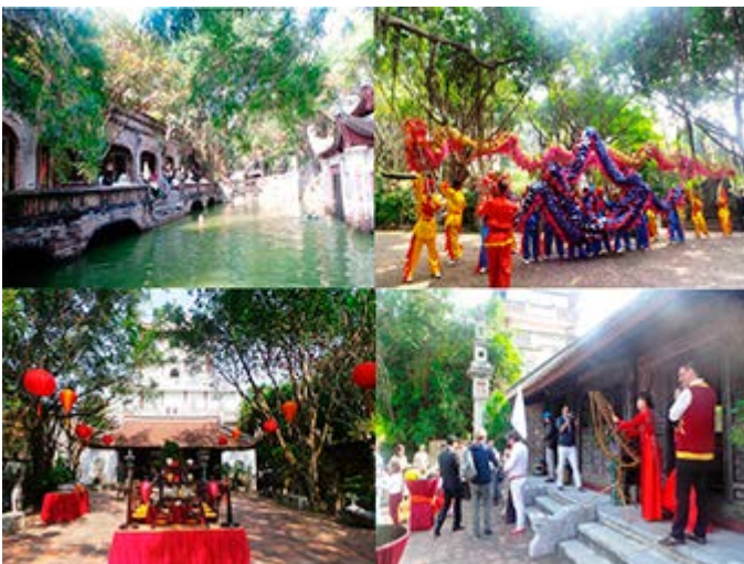
Hanoi Almuerzo en el Palacio Thanh Chuong