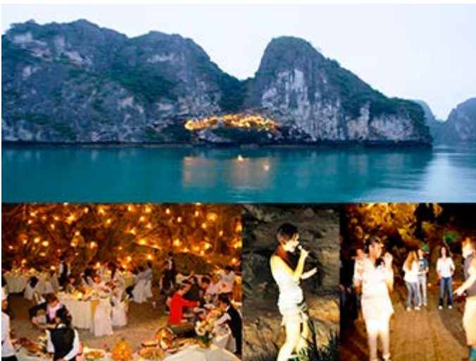
Cena en una Cueva de Halong Bay