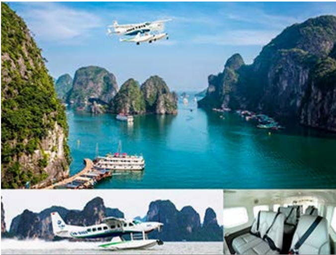
Vuelo en Hidroavión de Hanoi a la Bahía de Halong