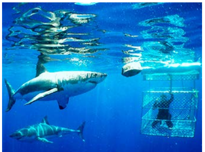
Ciudad del Cabo - Buceo con tiburones