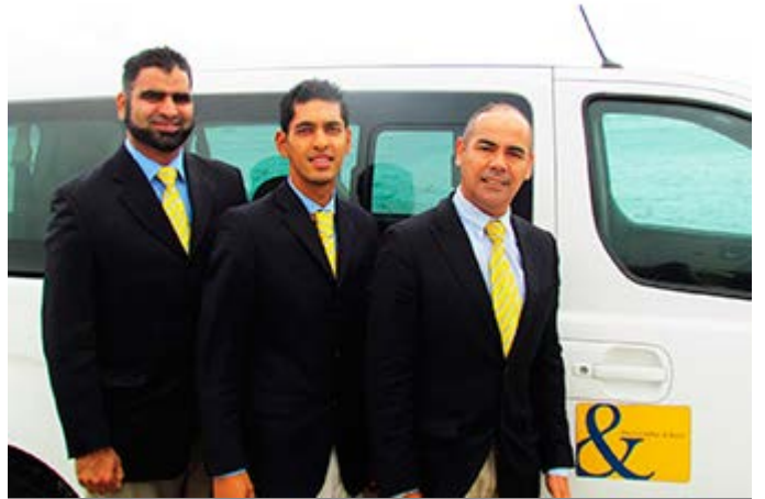
Servicio de Ángeles Guardianes en Ciudad del Cabo

Para reservar o solicitar una cotización de tu viaje a medida o de nuestros itinerarios, contacta con: