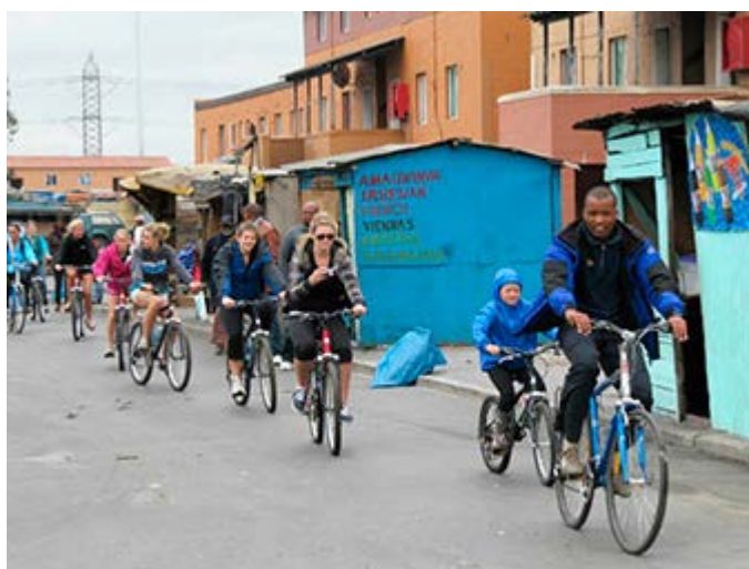
Visita de un Gueto en bicicleta