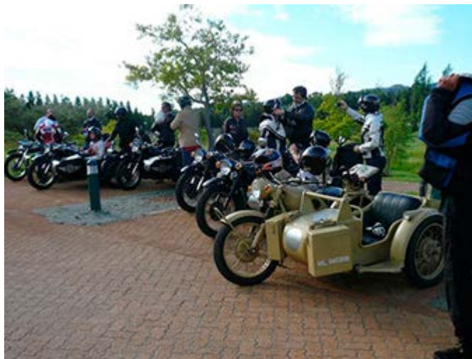
Traslados en Harley Davidson