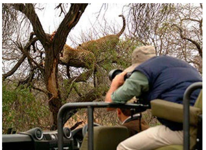
Excelentes safaris fotográficos