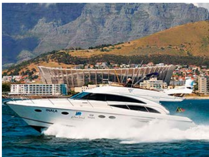
Ciudad del Cabo - Visita Robben Island en yate privado