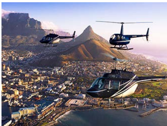
Ciudad del Cabo en Helicóptero