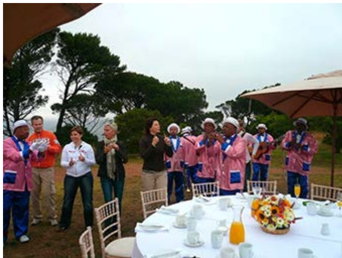
Ciudad del Cabo - Bienvenida en Signal Hill

Clic para descargar Actividades Unicas Insider Acces y Excursiones en PDF>