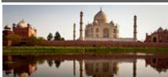
India, Nepal y Bután