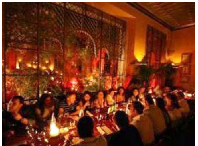
Cena en el Jad Mahal, animada y con estilo