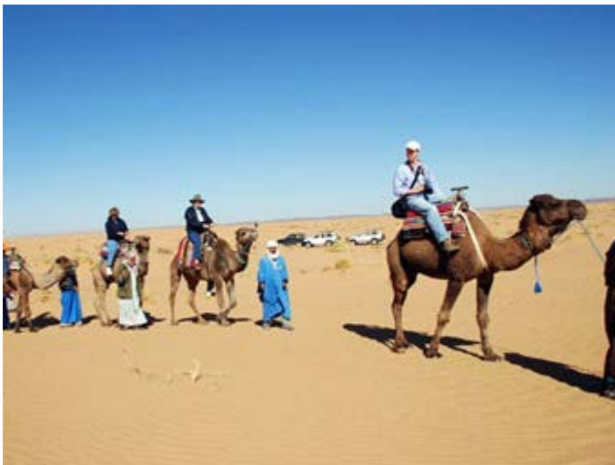
Suba en Camello