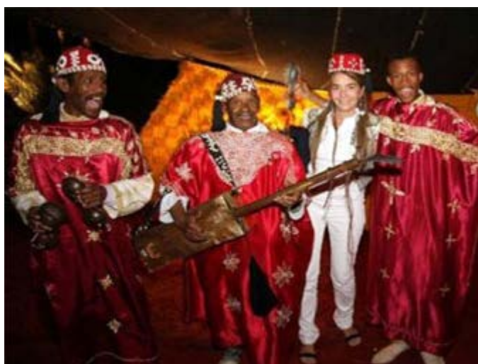
Entretenimiento musical en el Palmeral

Para reservar o solicitar una cotización de tu viaje a medida o de nuestros itinerarios, contacta con: