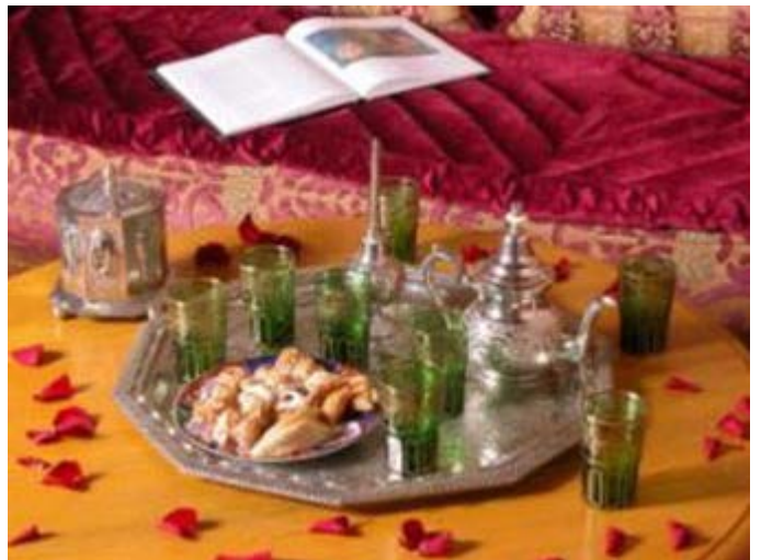
Té en un Riad tradicional