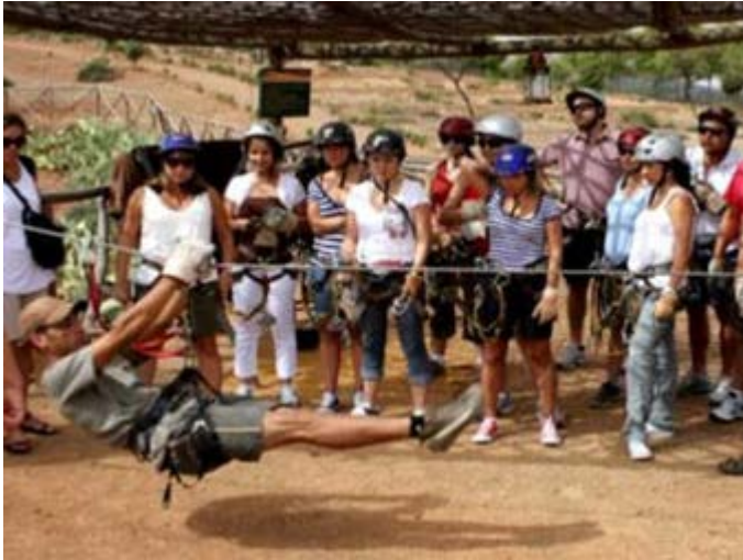
Actividades de Team Building