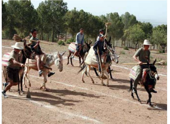
Partido de Polo con Burros