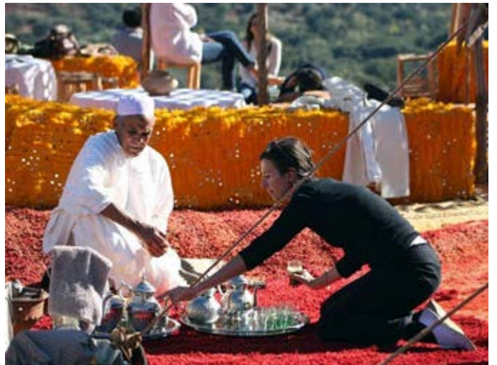
Auténticos encuentros culturales