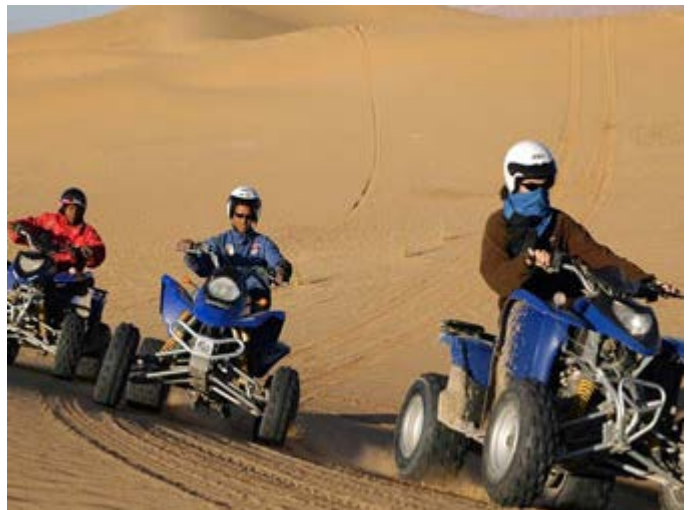
Paseo en Quads por el Desierto o cerca de Marrakech