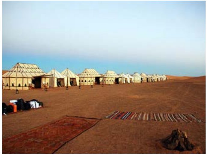
Nuestro Exclusivo Camp en el Desierto para grupos