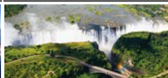
Zimbabue y Zambia