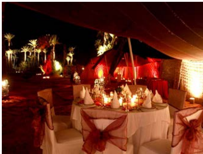
Cena en el Palmeral de Marrakech