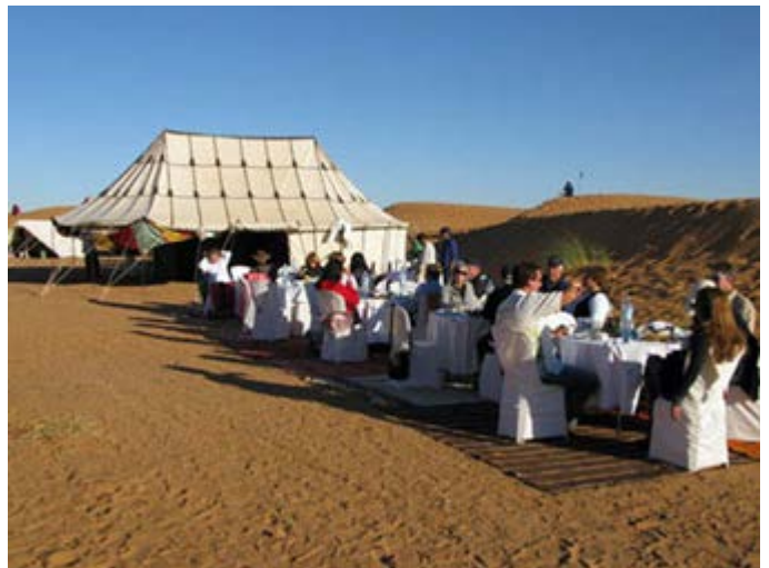
Almuerzo en nuestro Exclusivo Camp en el Desierto