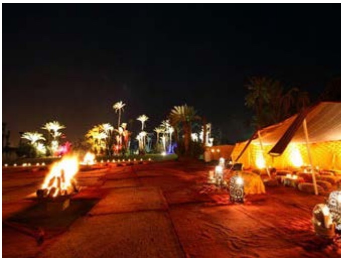
Cena en el Palmeral de Marrakech al estilo Berever