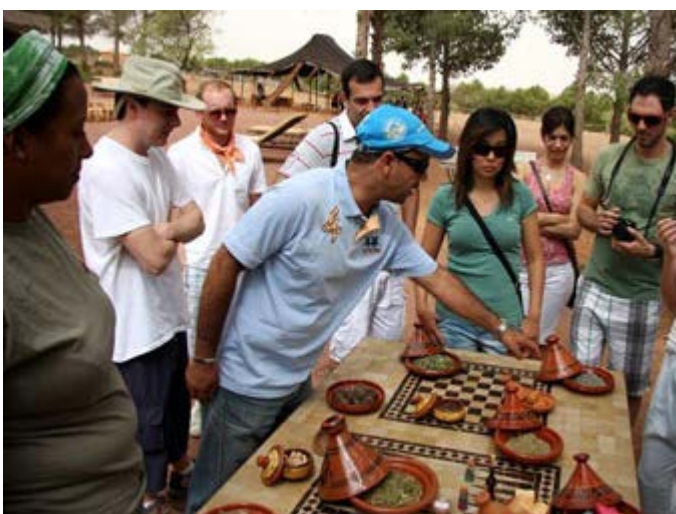
Aprenda sobre las Especies