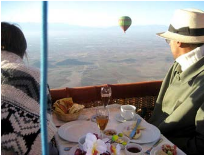
Paseo en Globo con Champagne y visita poblado Bereber

Te ofrecemos auténticas y estimulantes experiencias para que tu viaje sea increíble, emocionante, intrigante, rejuvenecedor y memorable. Actividades para profundizar, entender o interactuar con la verdadera cultura del lugar que está visitando. Algunas experiencias son de acceso exclusivo y privilegiado y representan toda una nueva experiencia para el viajero. Nuestro objetivo es satisfacer y superar las expectativas de tus clientes