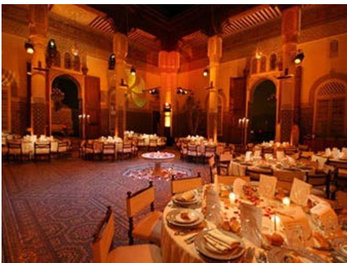
Cena en el Palacio Soleiman, de estilo Árabe-Andaluz