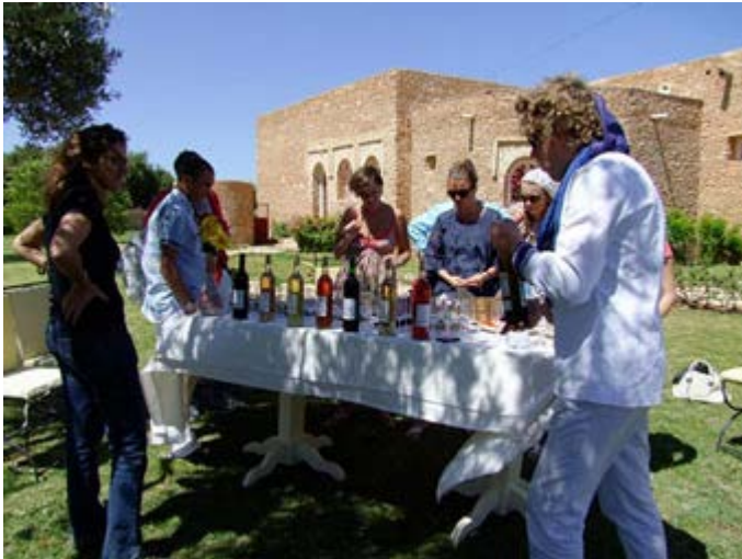
Qué le parece una Cata de Vinos Marroquí?