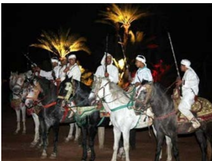
Espectacular show de caballos en el Palmeral