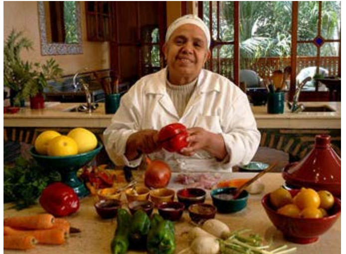
Clases de Cocina Marroquí