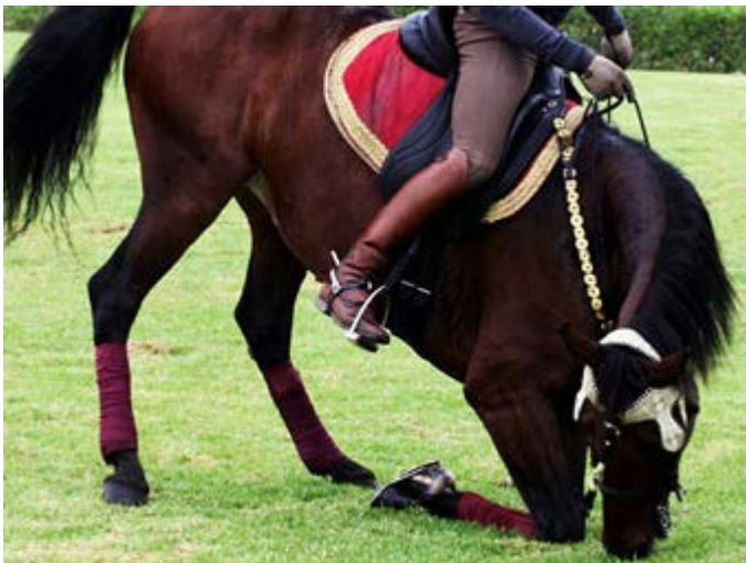
Almuerzo en Selman con show de Caballos Árabes