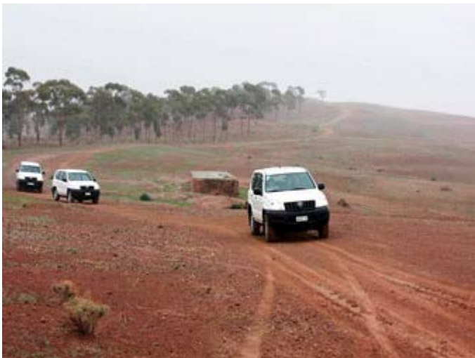
Conduzca en 4x4 por el Desierto o cerca de Marrakech