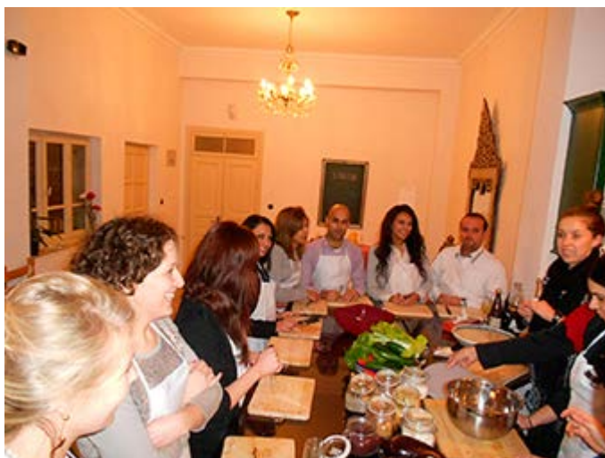
Clases de cocina en Beit Sitti (la casa de mi abuela), aprenda algunos deliciosos platos y postres locales