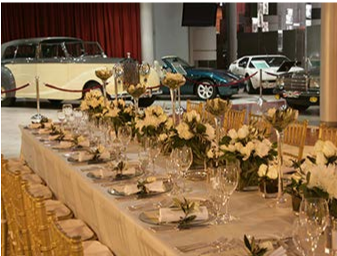
Amman Cena Museo Real del Automovil