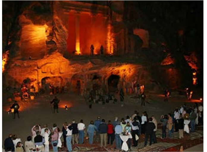
Cóctel en la Pequeña Petra