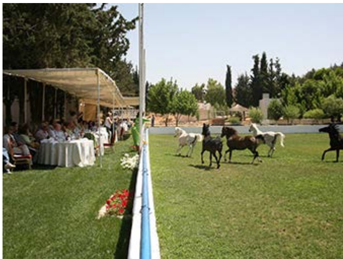
Amman Desayuno en los Establos Reales

Te ofrecemos auténticas y estimulantes experiencias para que tu viaje sea increíble, emocionante, intrigante, rejuvenecedor y memorable. Actividades para profundizar, entender o interactuar con la verdadera cultura del lugar que está visitando. Algunas experiencias son de acceso exclusivo y privilegiado y representan toda una nueva experiencia para el viajero. Nuestro objetivo es satisfacer y superar las expectativas de tus clientes