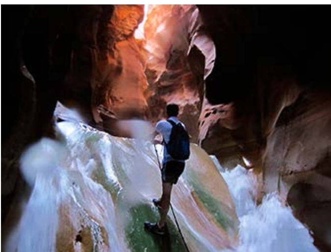
Excursión por la garganta (Siq) de agua del río Mujib