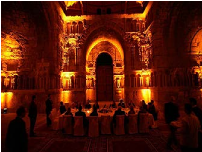
Amman Cena Palacio Umayyad en la Ciudadela