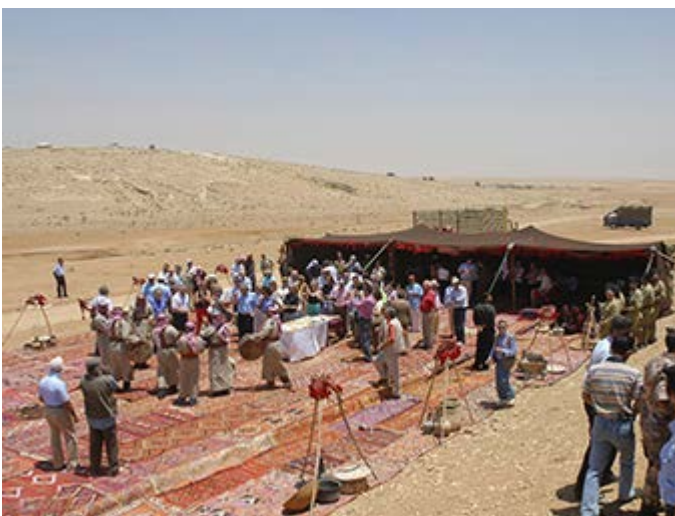
Amman Paseo Tren Otomano y Ataque Beduino