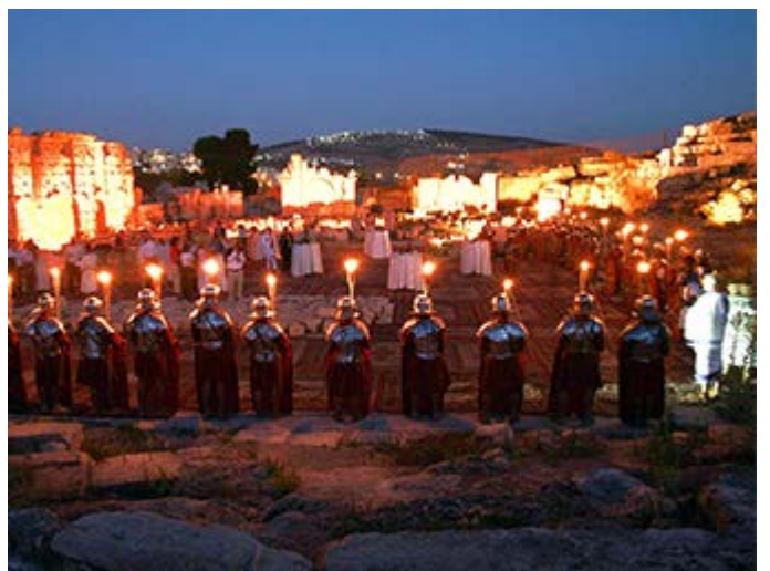
Jerash Cóctel en las Ruinas Romanas