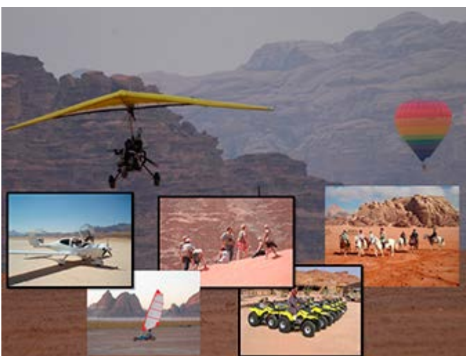
Actividades en el Desierto de Wadi Rum