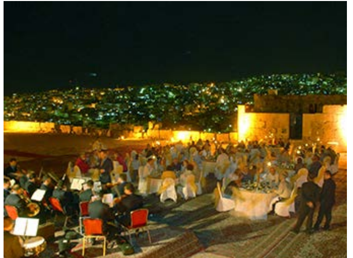
Amman Cena en la Ciudadela