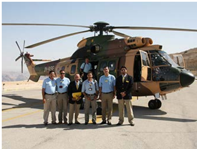
Traslados en Heliópteros Reales de Amman a Petra