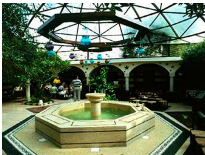
Experimente Al-Pasha Turkish Bath, el más elegante baño turco