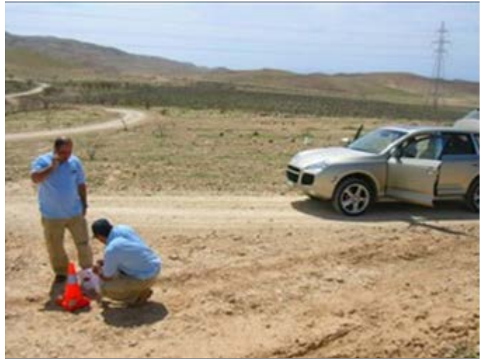
Rally en el Valle del Jordán