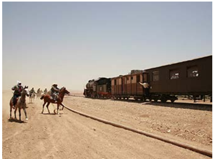
Amman Paseo Tren Otomano y Ataque Beduino