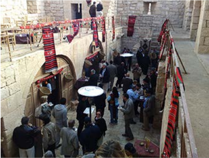
Almuerzo en Castillo Qatraneh entre Amman y Petra