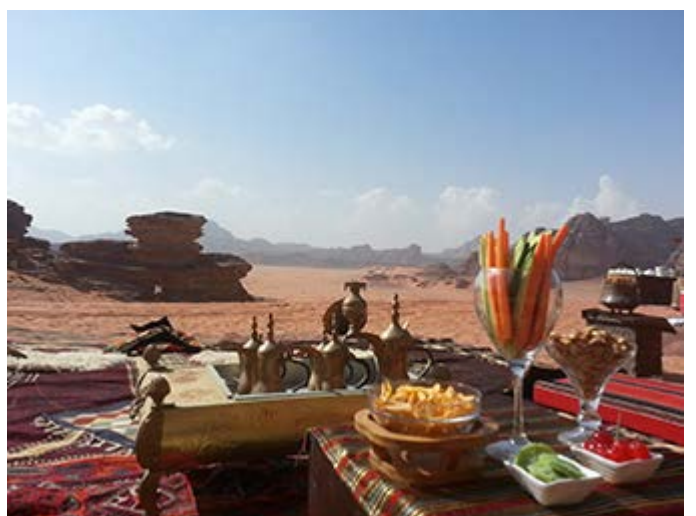
Recepción y Puesta de Sol en Wadi Rum