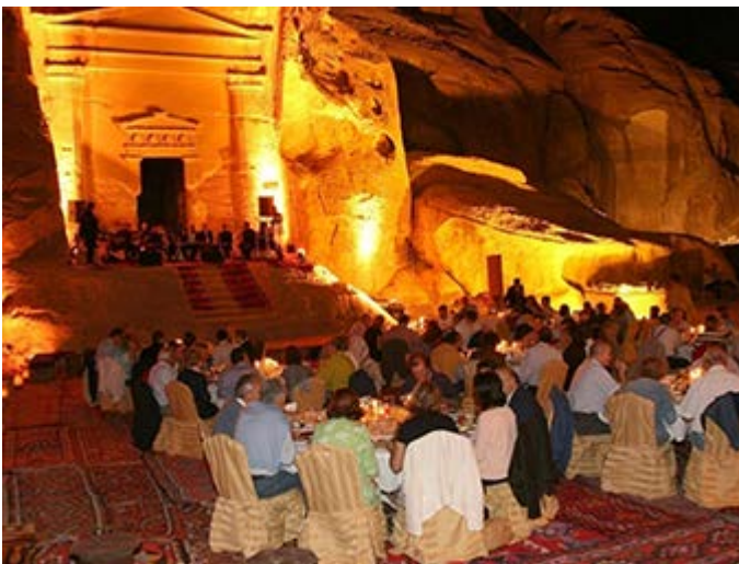
Cena en la Pequeña Petra, para individuales y grupos