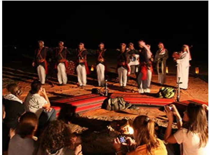
Entretenimiento en Wadi Rum

Para reservar o solicitar una cotización de tu viaje a medida o de nuestros itinerarios, contacta con: