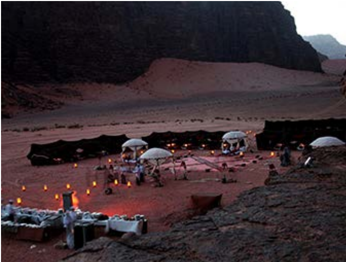
Cena en el Desierto de Wadi Rum