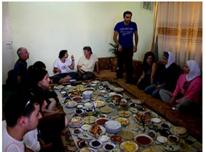
Cena con una Familia Local en Azraq