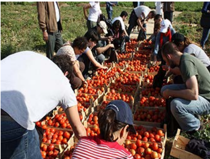
Valle Jordan Actividades con la Comunidad Local