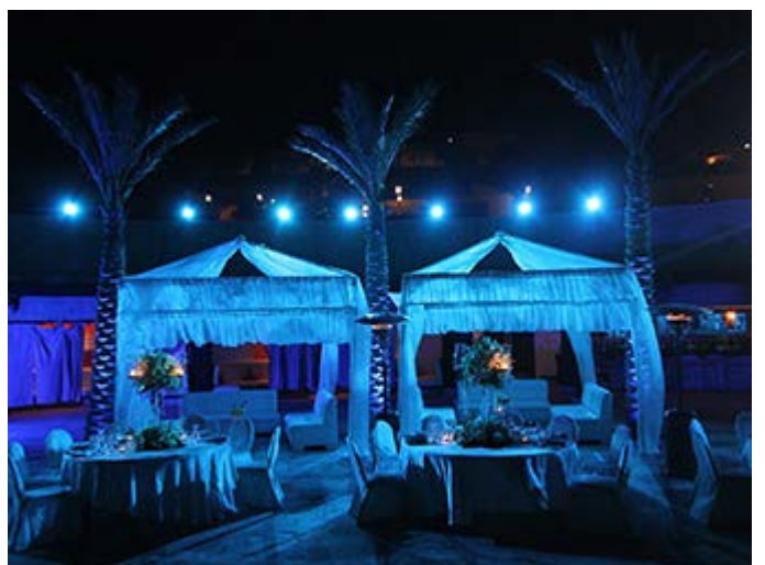
Cena 1001 Noches en el Mar Muerto