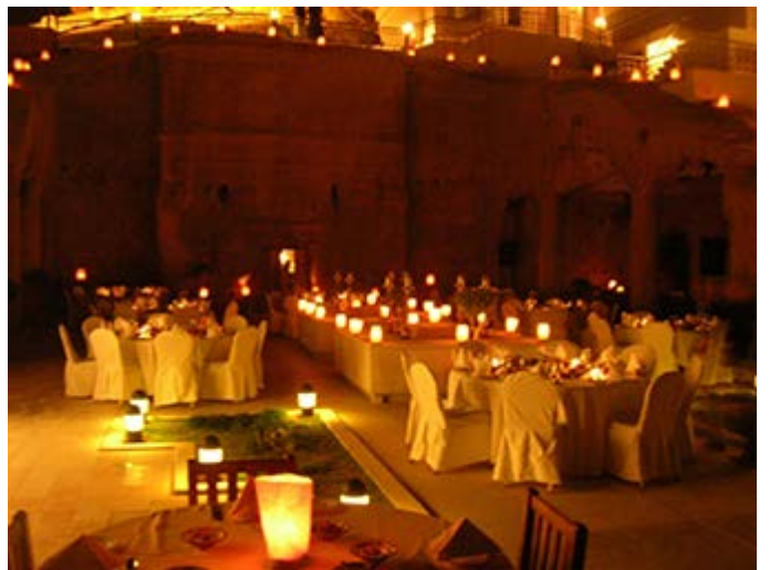
Petra Cena en una Cueva Nabatea