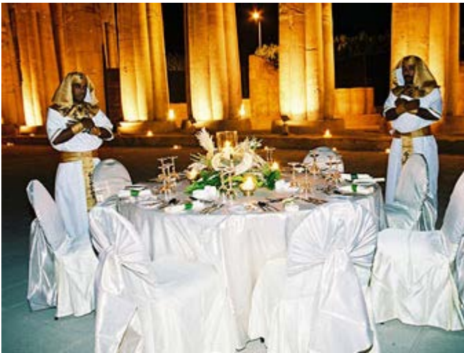
Cena en el Templo de Luxor