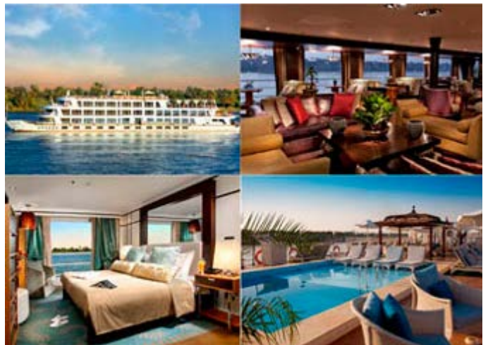
Sanctuary Sun Boat IV - 40 Cabinas