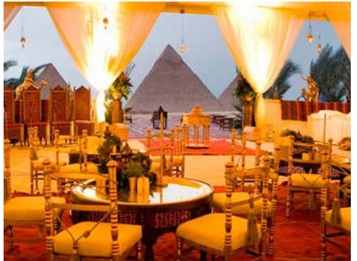
Vista desde la tienda Cena 1001 Noches