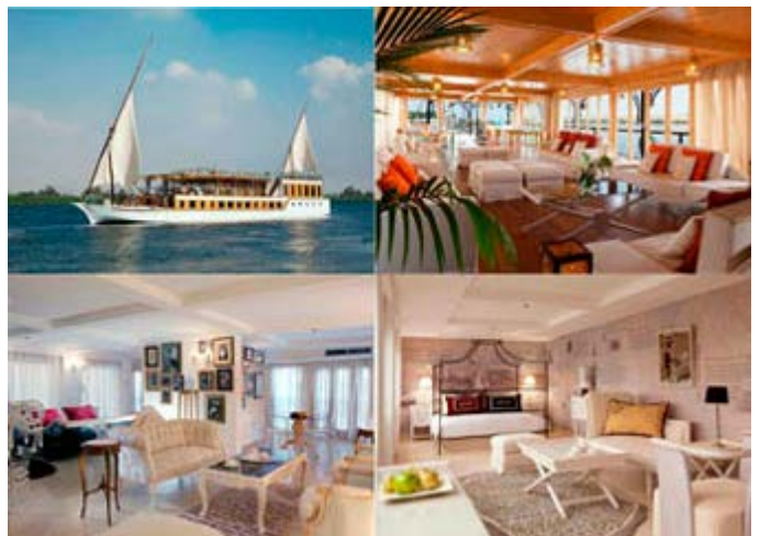
Sanctuary Zein Nile Chateau- Dahabeya 6Cabinas