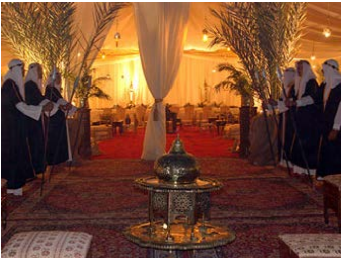
Interior de la tienda Cena 1001 Noches