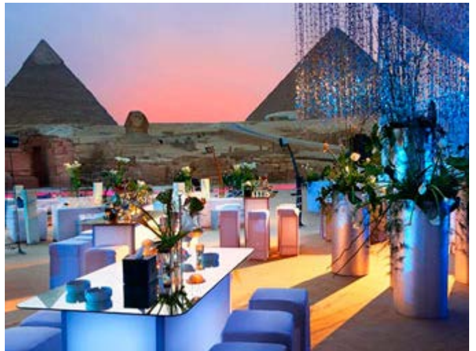
Cena luz y sonido en la Esfinge