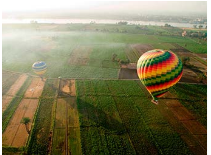
Globo en Luxor con vistas espectaculares