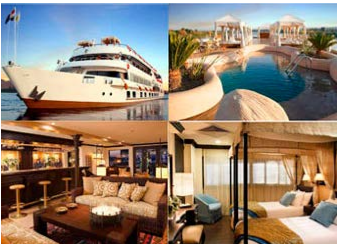
Sanctuary Sun Boat III - 18 Cabinas