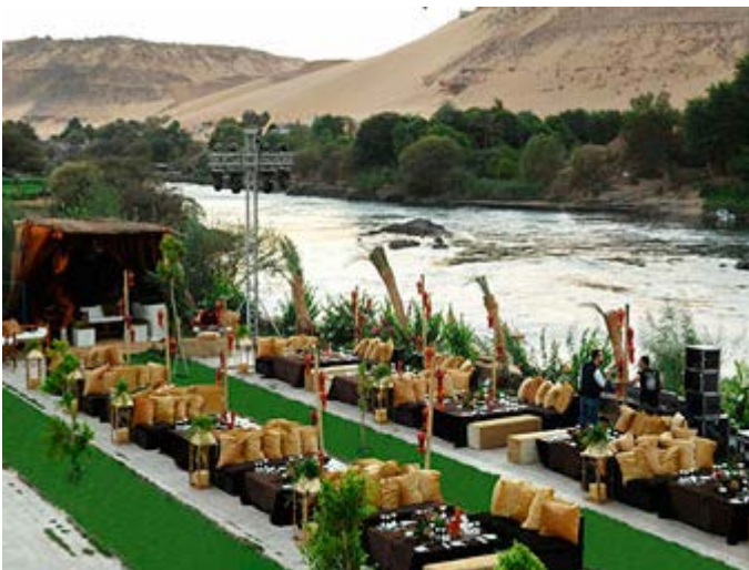
Cena Nubia en Aswan