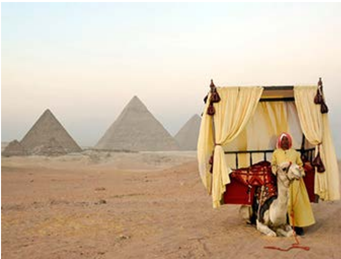
Extraordinarias maneras de ver las Pirámides