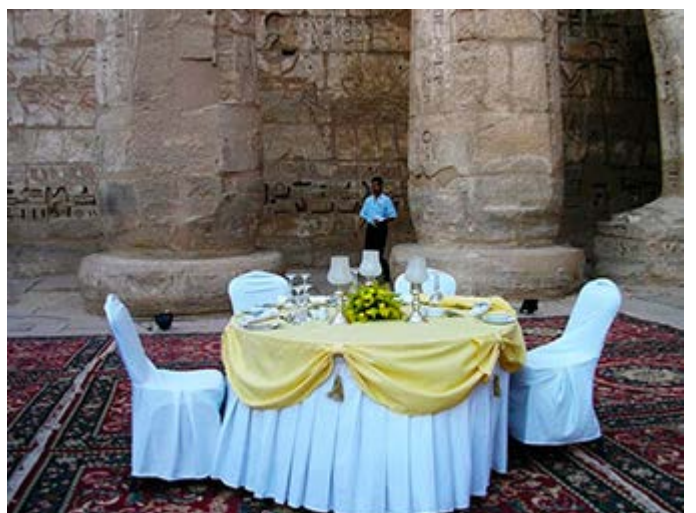
Cena privada en un Templo de Luxor