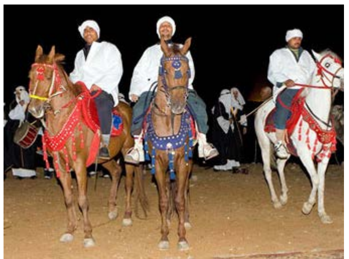
Bienvenida con caballos y danzas