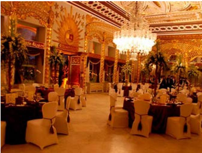
Cena en el Palacio Manial de El Cairo

Te ofrecemos auténticas y estimulantes experiencias para que tu viaje sea increíble, emocionante, intrigante, rejuvenecedor y memorable. Actividades para profundizar, entender o interactuar con la verdadera cultura del lugar que está visitando. Algunas experiencias son de acceso exclusivo y privilegiado y representan toda una nueva experiencia para el viajero. Nuestro objetivo es satisfacer y superar las expectativas de tus clientes