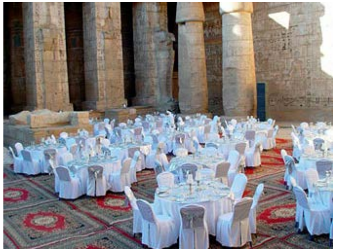
Cena en el Templo Medinet Habu en Luxor