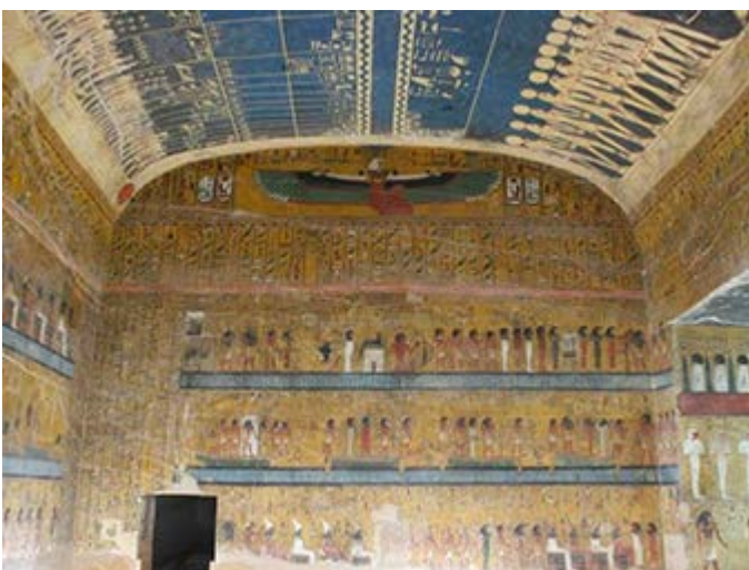
Acceso privado exclusivo a la Tumba de Seti