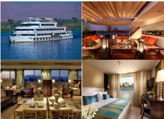
Sanctuary Nile Adventurer - 32 Cabinas

Clic para Ver toda la información de los Cruceros Sanctuary Retreats>