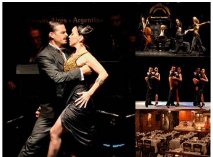
Cóctel de bienvenida en la Ventana Tango