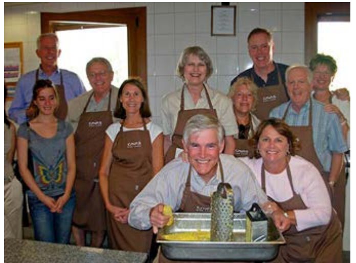
Mendoza - Experiencia Culinaria en Las Cavas