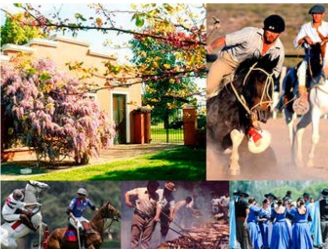
Un día en una Estancia cerca de Buenos Aires