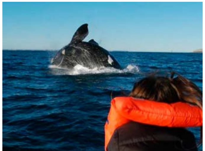
Peninsula Valdes - Avistamiento de Ballenas

Para reservar o solicitar una cotización de su itinerario a medida o de nuestros itinerarios, contacta con: