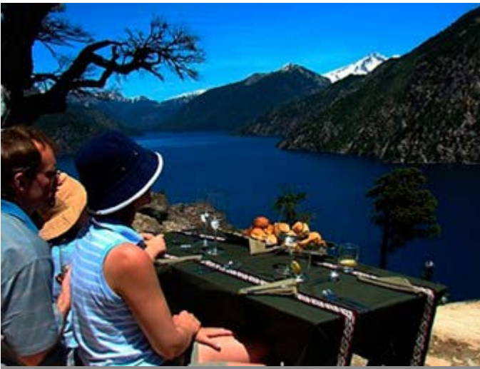
Actividades en Bariloche