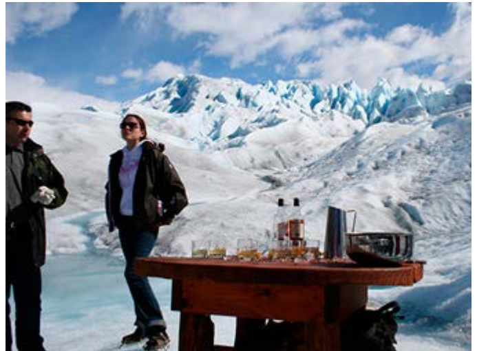
Patagonia - Aperitivo en Perito Moreno