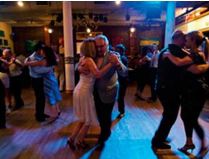
Baile un Tango con los Porteños