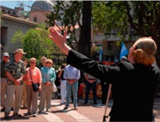
Buenos Aires Visita recreandom momentos historicos

Te ofrecemos auténticas y estimulantes experiencias para que tu viaje sea increíble, emocionante, intrigante, rejuvenecedor y memorable. Actividades para profundizar, entender o interactuar con la verdadera cultura del lugar que está visitando. Algunas experiencias son de acceso exclusivo y privilegiado y representan toda una nueva experiencia para el viajero. Nuestro objetivo es satisfacer y superar las expectativas de tus clientes