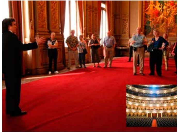
Visita Teatro Colón con Actuación Privada