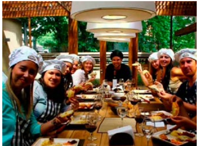
Buenos Aires Experiencia Culinaria