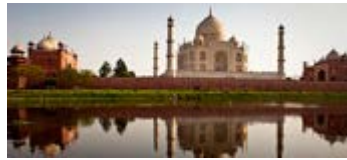
India, Nepal y Bután