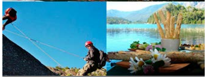
Actividades en Bariloche