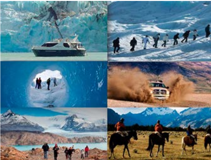
Patagonia - Actividades