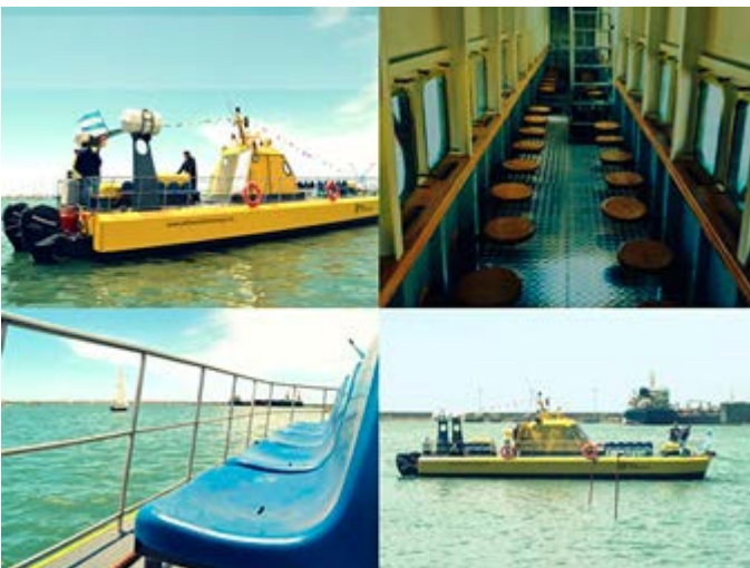
Peninsula Valdes - Submarino Amarillo