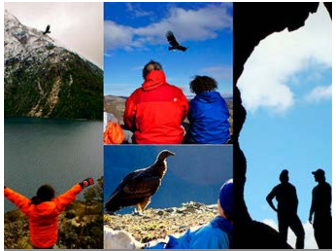
Bariloche - Experiencia Condor