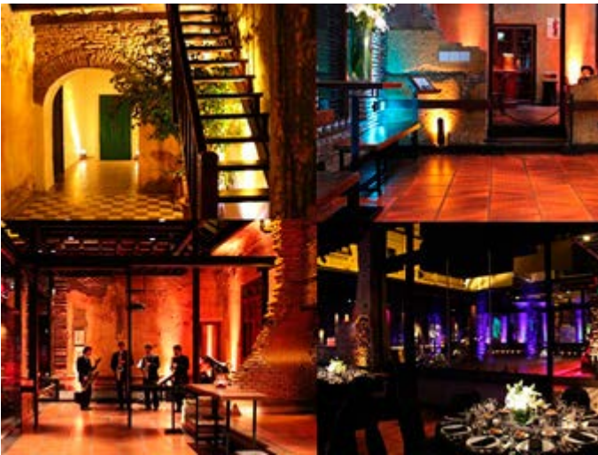
Buenos Aires Cenade Gala en La Casa Mínima