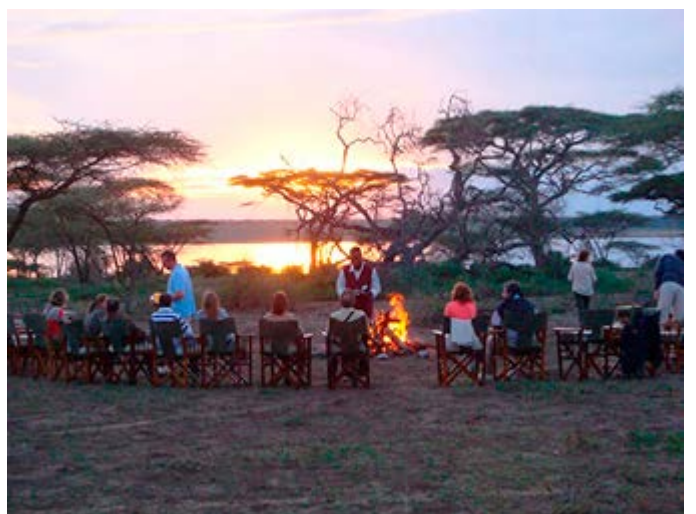
Sundowner - Aperitivo a la puesta del sol en la Sabana