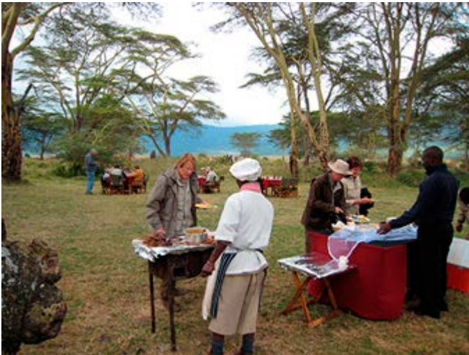
Almuerzo Barbacoa en el Cráter de Ngorongoro