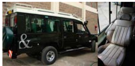
Nuevos 4x4 VIP con Internet