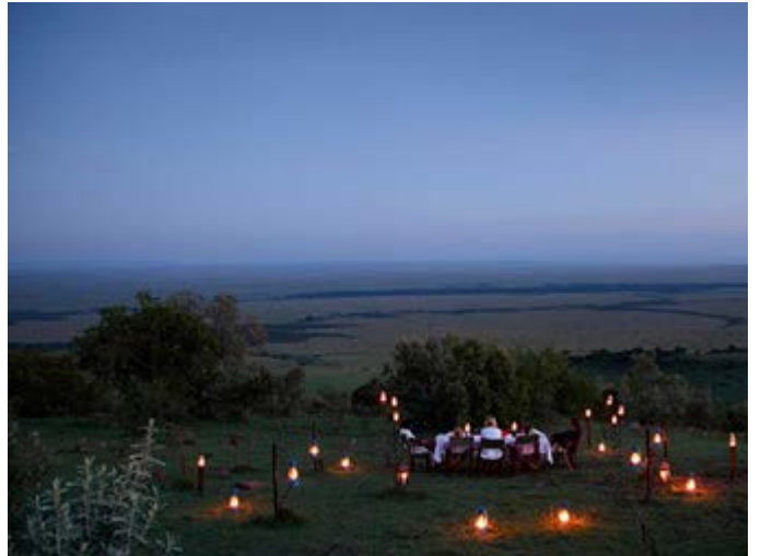
Cena en la Sabana