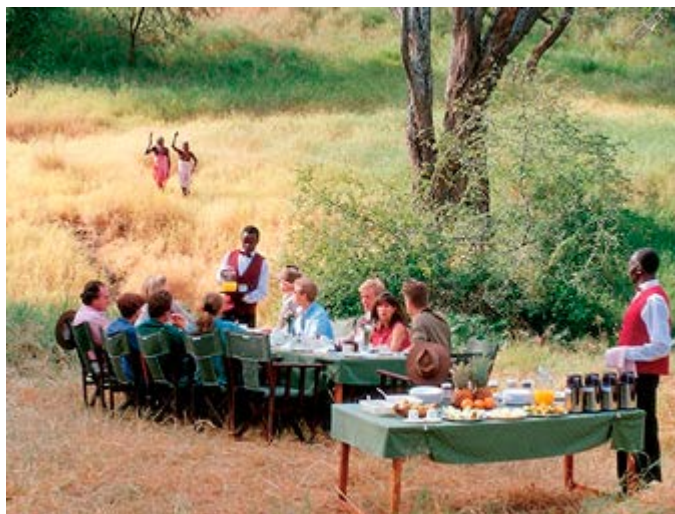
Desayuno en la Sabana