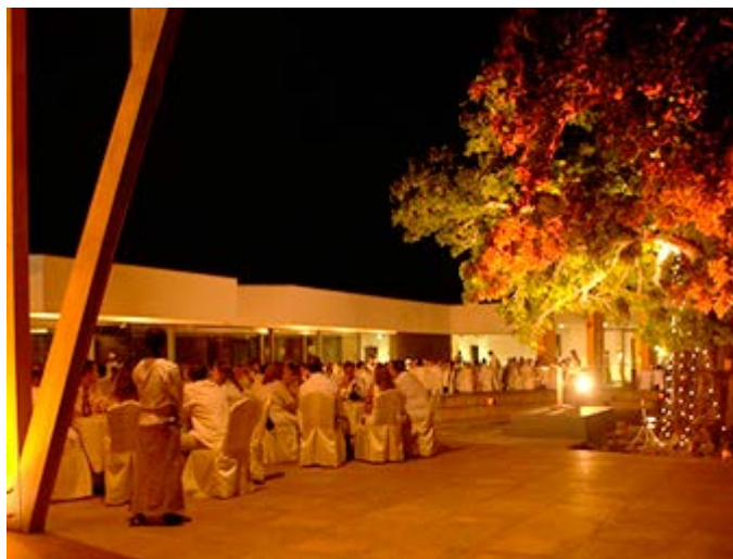
Cena en la Playa en la Gemma Dell'Est en Zanzíbar

Para reservar o solicitar una cotización de su itinerario a medida o de nuestros Safaris en Español, contacta con: