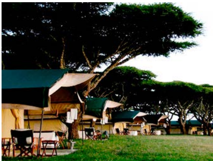
Exclusivo Camp Móvil cerca de la Migración- Único

Te ofrecemos auténticas y estimulantes experiencias para que tu viaje sea increíble, emocionante, intrigante, rejuvenecedor y memorable. Actividades para profundizar, entender o interactuar con la verdadera cultura del lugar que está visitando. Algunas experiencias son de acceso exclusivo y privilegiado y representan toda una nueva experiencia para el viajero. Nuestro objetivo es satisfacer y superar las expectativas de tus clientes