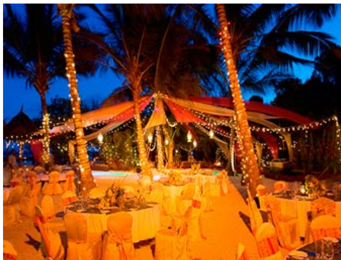
Cena en la Playa