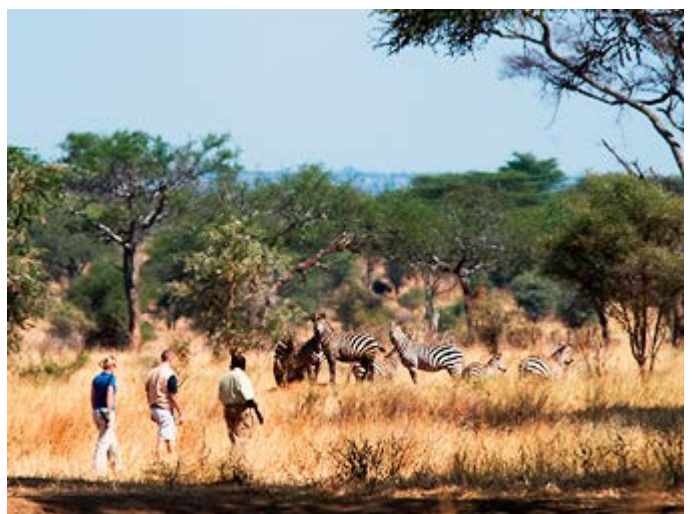
Safari a pie