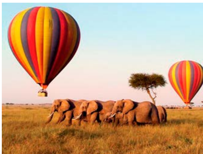
Vuelo en Globo y Desayuno con champagne