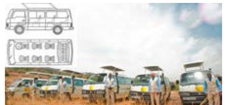
Minibús en KENIA