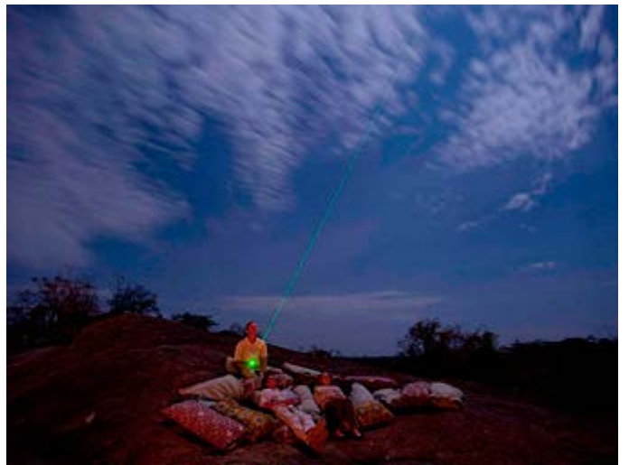
Avistamiento de estrellas en el Serengeti