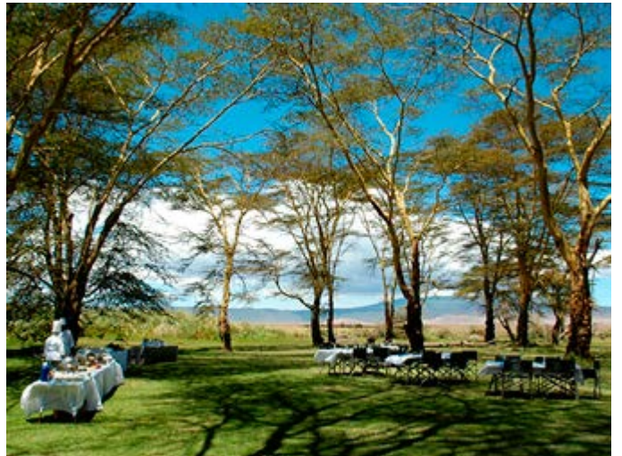
Almuerzo Barbacoa en el Cráter de Ngorongoro