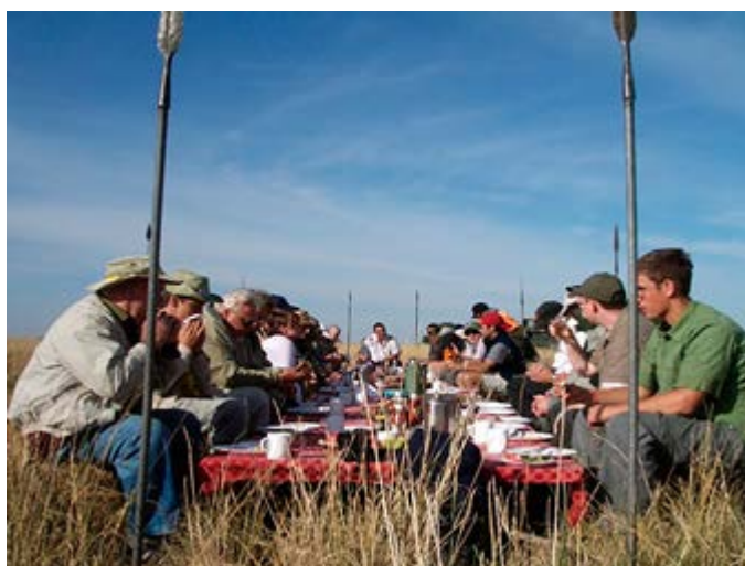
Desayuno con champagne después del Globo