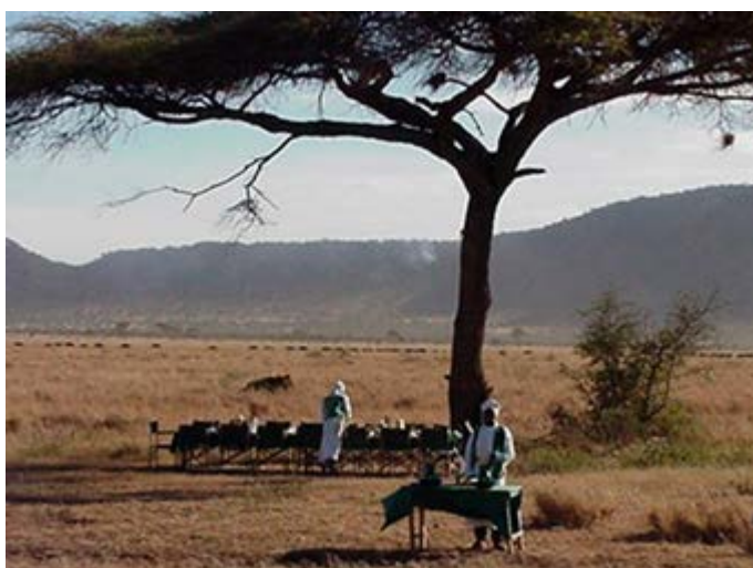
Desayuno con champagne después del Globo