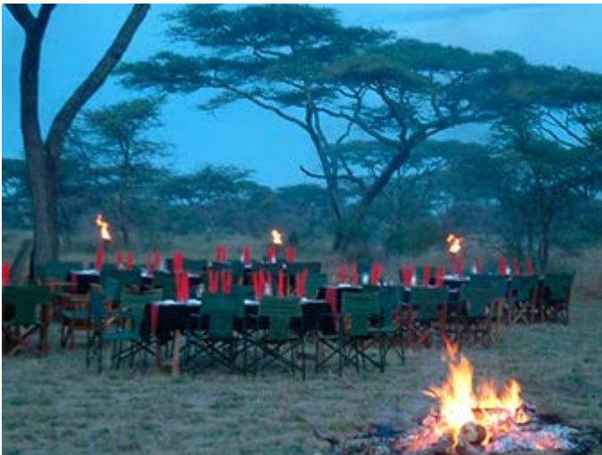
Cena en la Sabana