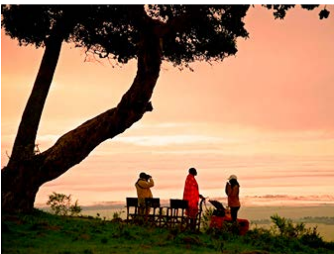
Sundowner - Aperitivo a la puesta del sol en la Sabana