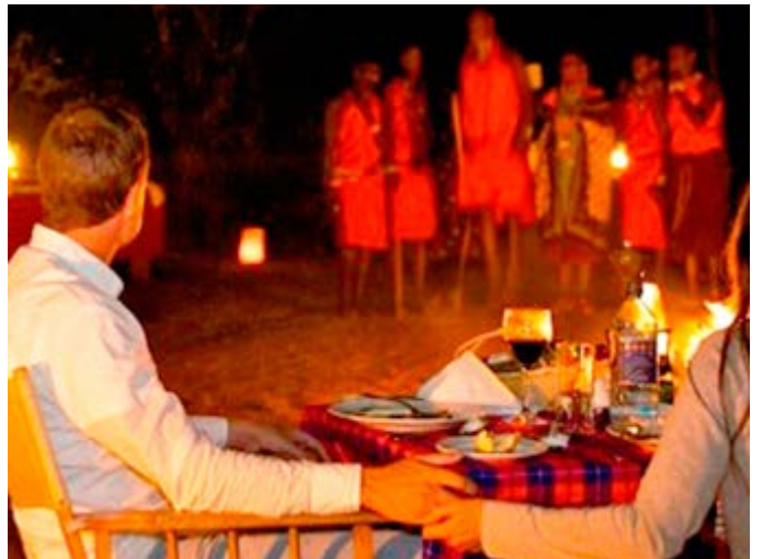
Cena en la Sabana con ataque Masai