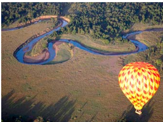
Vuelo en Globo y Desayuno con champagne