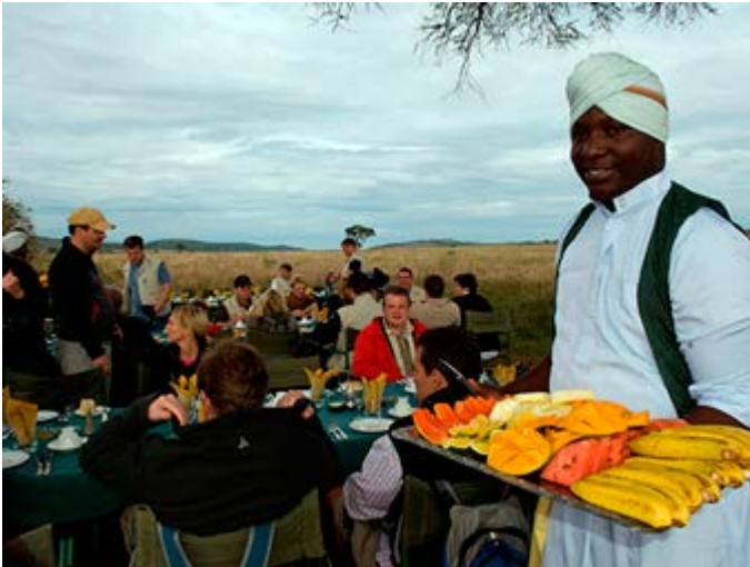
Almuerzo en la Sabana