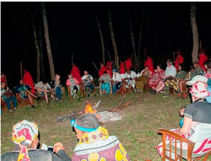
Cena Kikoi en la Sabana