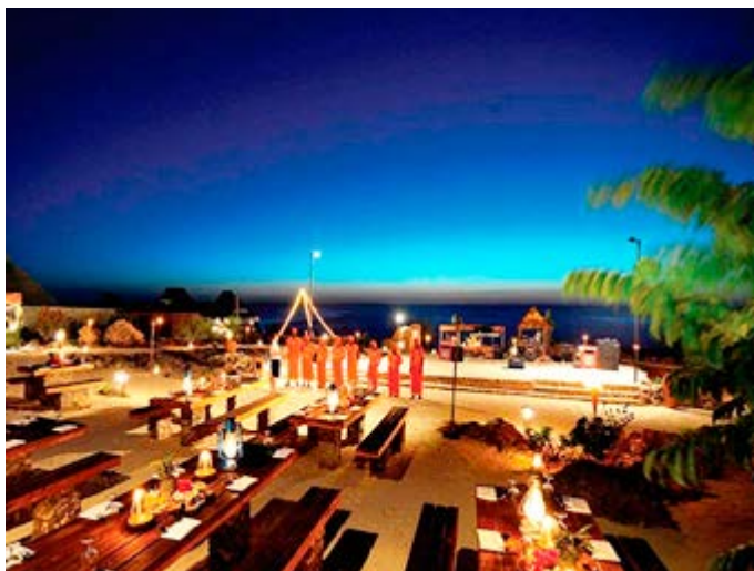
Cena en la Playa en la Gemma Dell'Est en Zanzíbar