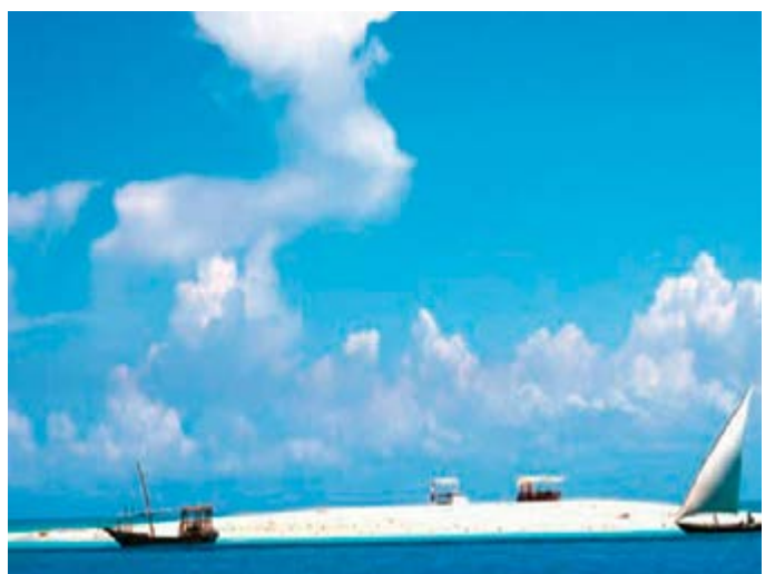
Snorkel en Mnemba, Zanzíbar, con mariscada