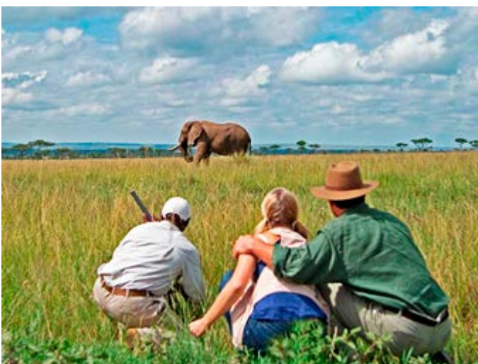
Safari a pie