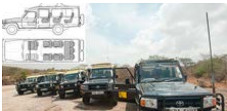
4x4 en KENIA Y TANZANIA

Chóferes Guía Profesionales de habla española para todos los safaris terrestres, en cada vehículo