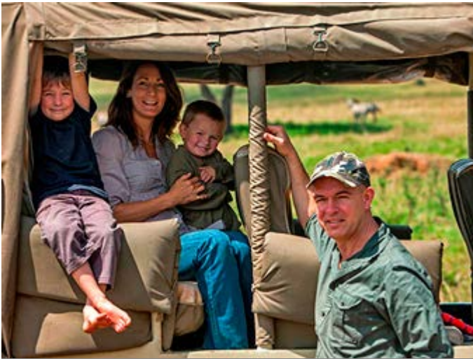
Safari en Familia