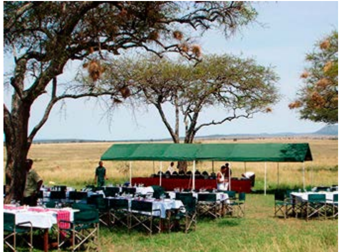
Almuerzo en la Sabana