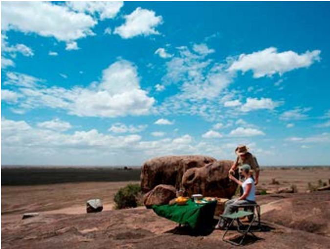
Sundowner - Aperitivo a la puesta del sol en la Sabana