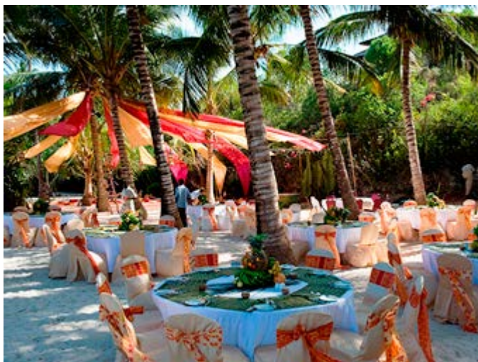
Cena en la Playa