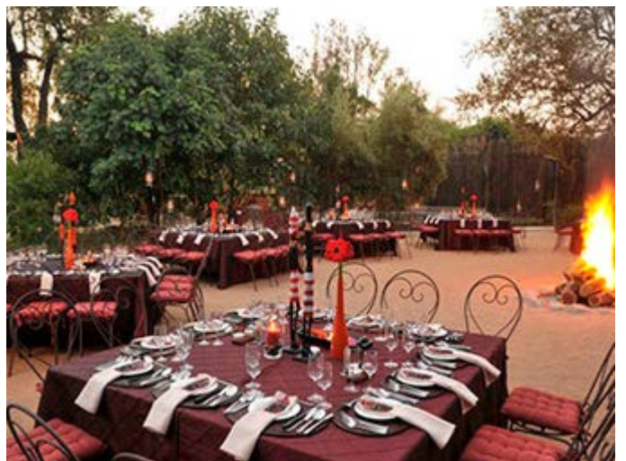
Cena bajo las estrellas