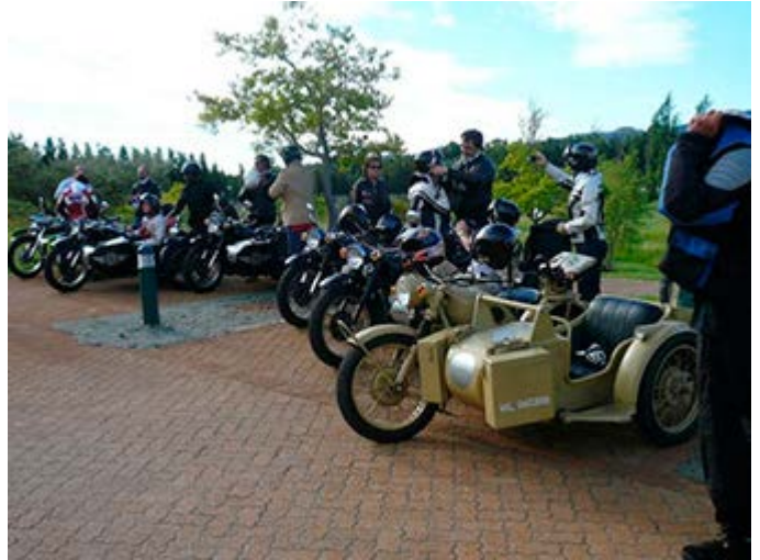
Traslados en Harley Davidson