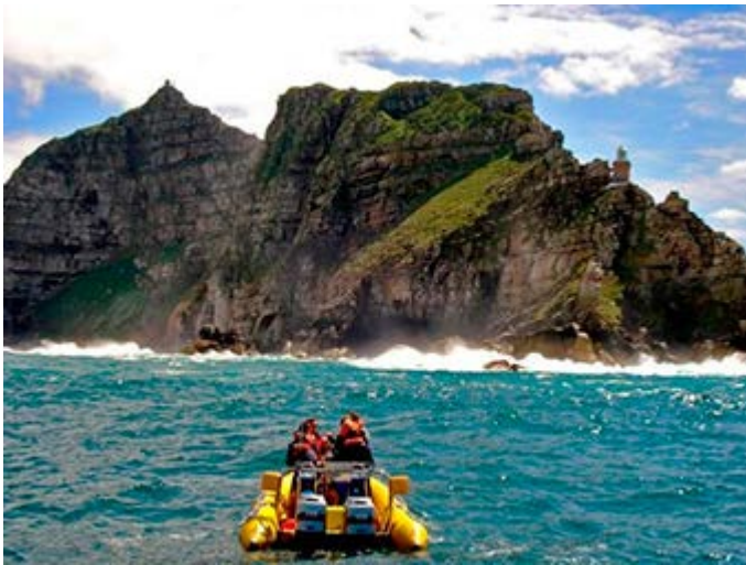
Visita de la Punta del Cabo en zodiac