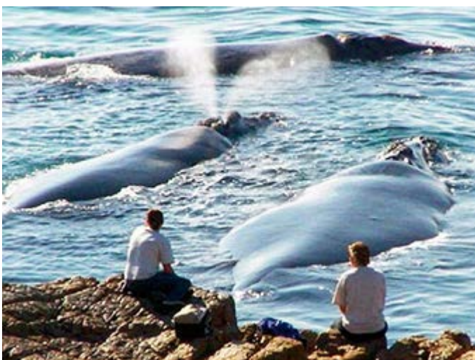
Hermanus - Avistamiento de ballenas