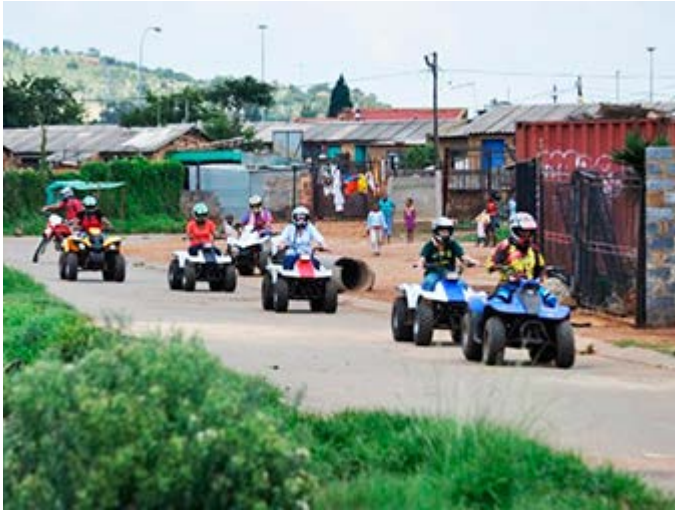
Johannesburgo - Visita Soweto en Quads