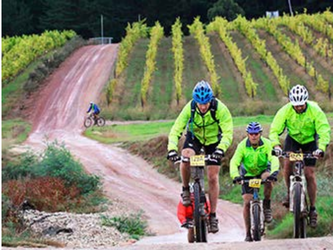
Los viñedos en bicicleta