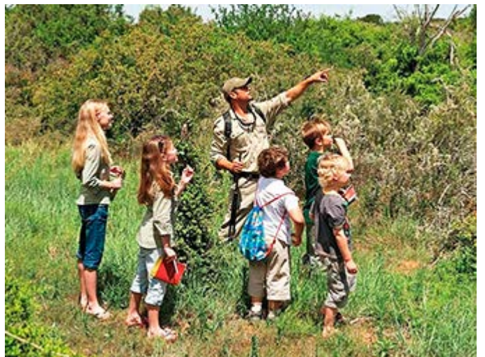
Actividades de safari con niños