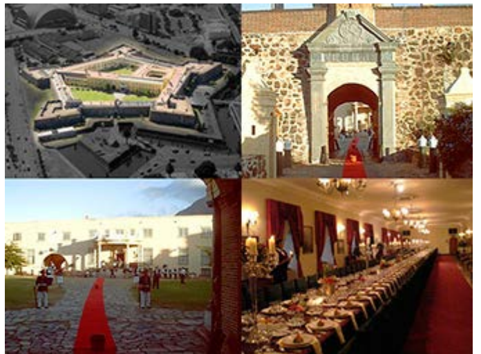
Cena de Gala en el Castillo de Buena Esperanza