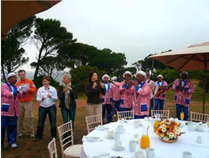
Ciudad del Cabo - Bienvenida en Signal Hill

Clic para descargar Actividades Únicas Insider Access, Excursiones y Precios 2015 para Individuales >