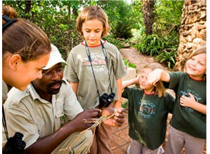
Actividades de safari con niños