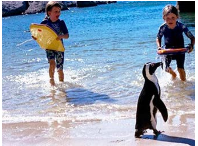
Ciudad del Cabo - Niños bañándose con los locales