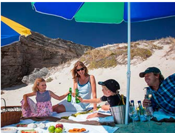
Ciudad del Cabo - Picnic Privado en la playa