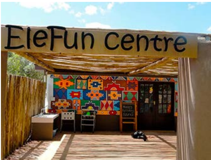
Especial para niños - Elefun Centre en Sabi Sabi