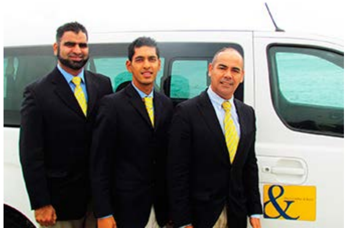
Servicio de Ángeles Guardianes en Ciudad del Cabo

Para reservar o solicitar una cotización de tu viaje a medida o de nuestros itinerarios, contacta con: