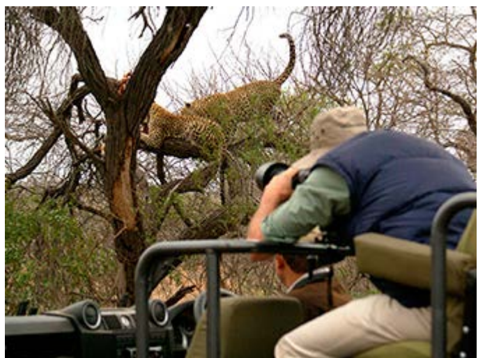
Excelentes safaris fotográficos