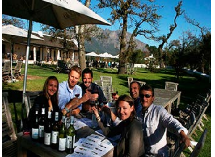
Degustación o cata de vinos