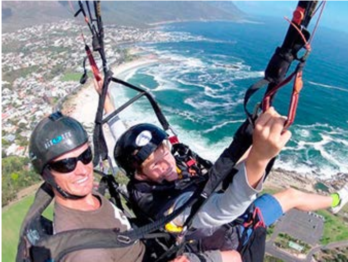
Ciudad del Cabo - Paracaidismo