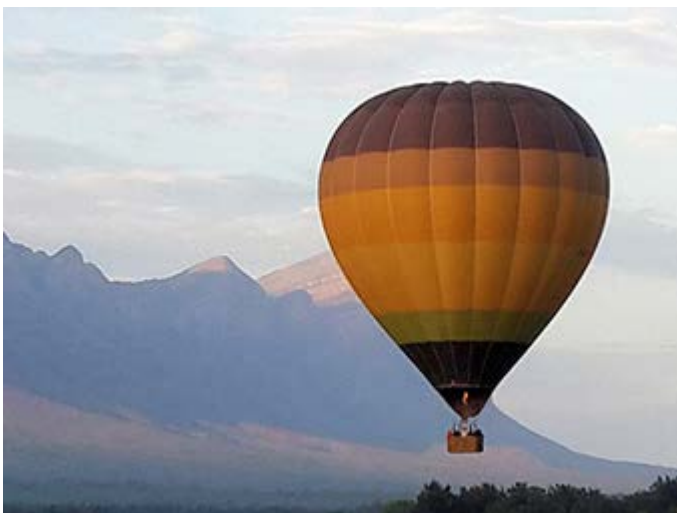
Vuelo en Globo en Hoedspruit (Área Kruger)