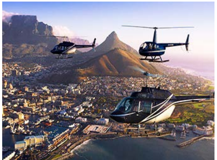
Ciudad del Cabo en Helicóptero