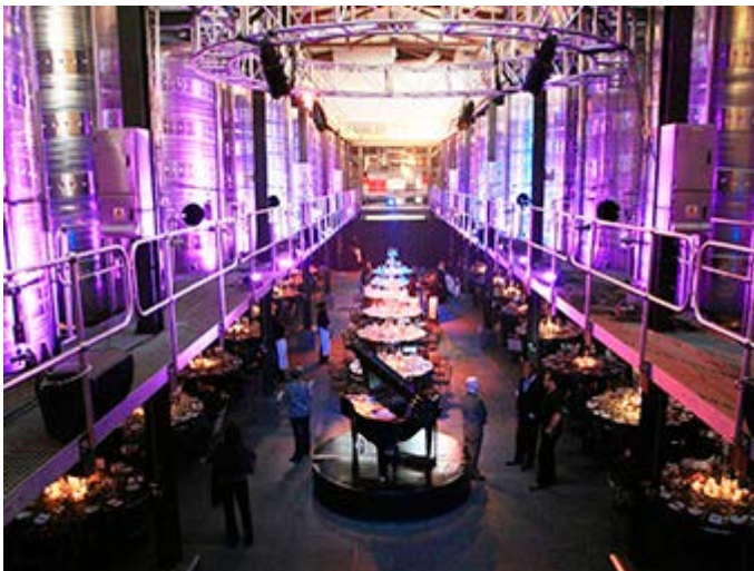
Cena de Gala en una Bodega