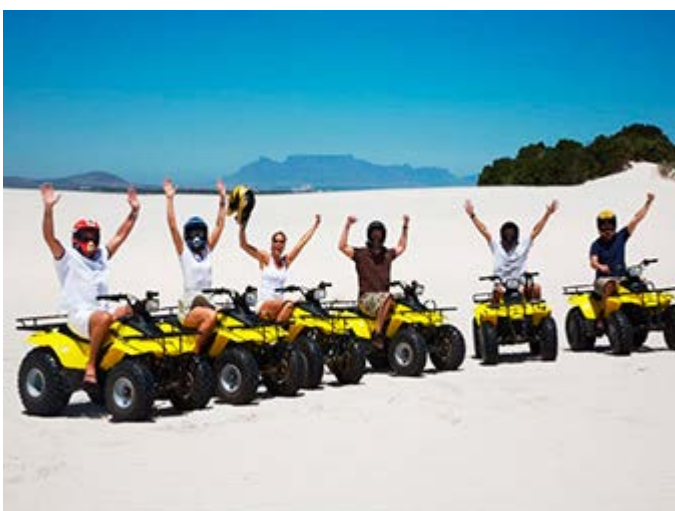
Ciudad del Cabo Actividades en quads