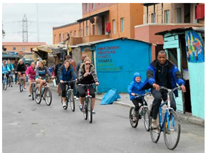
Visita de un Gueto en bicicleta