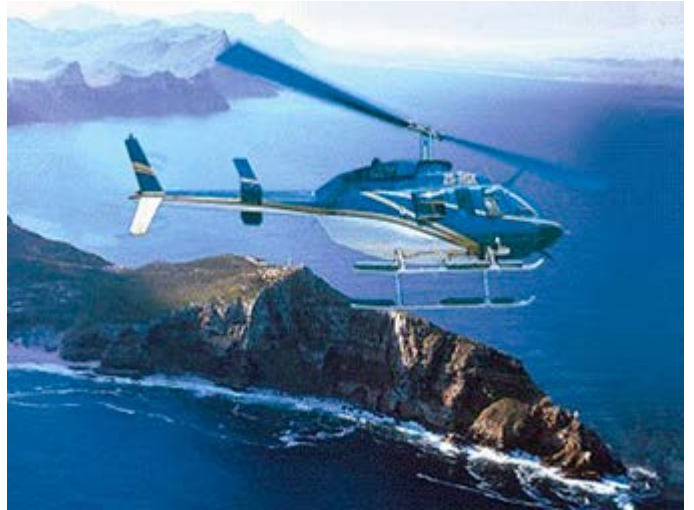
Visita de la Punta del Cabo en helicóptero