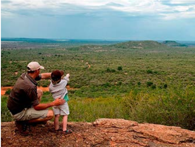
Madikwe - Un día con un Ranger