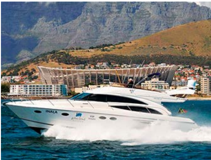
Ciudad del Cabo - Visita Robben Island en yate privado