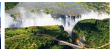
Zimbabwe y Zambia