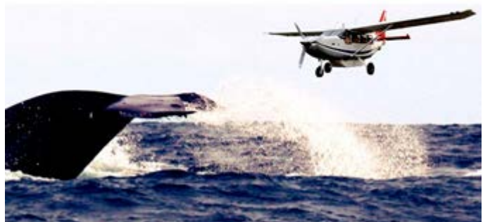
Aviste Ballenas desde una Avioneta