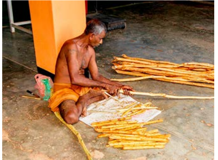
Aprenda cómo se manipula y prepara la canela