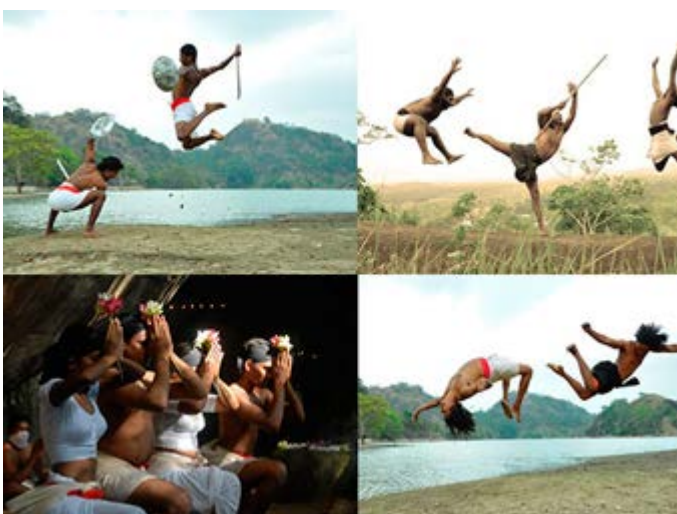
Representación de Arte Marcial local Angampora