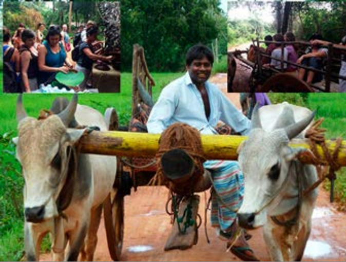
Paseo por una Aldea en carro de bueyes