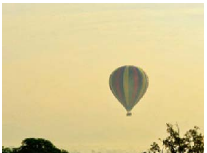
Vuelo en Globo en el Triangulo Cultural