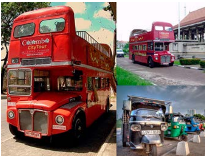
Divertido transporte para visitas en Colombo