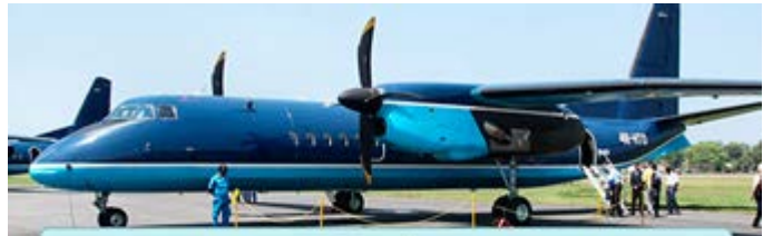
MA60 Plane Capacity: 60 passengers