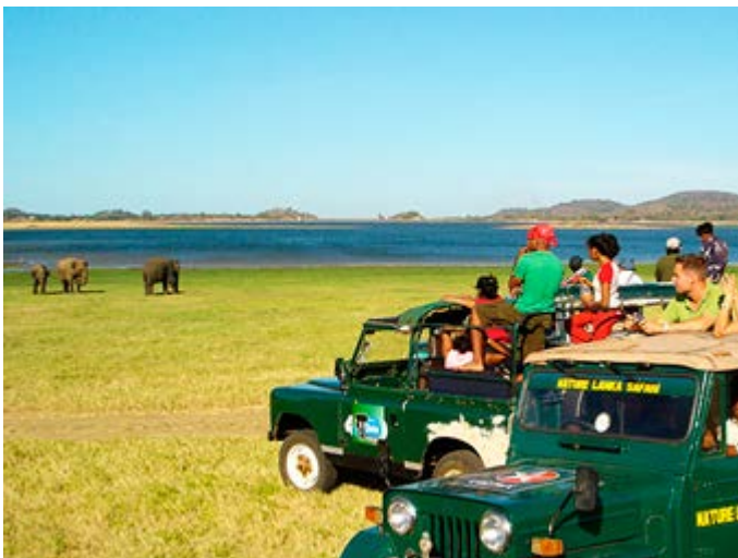
Safaris en los Parques Nacionales Minneriya o Yala