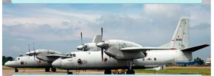
ANTONOV Plane Capacity: 42