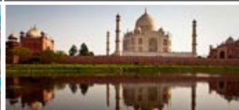
India, Nepal y Bután