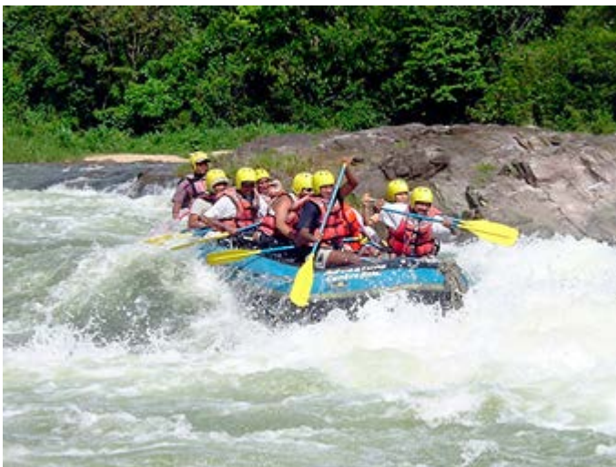
Rafting en los rápidos de Kitulgala