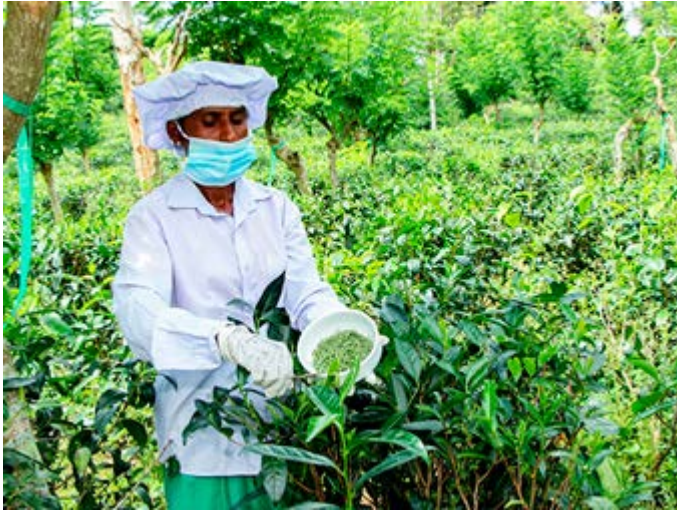
Aprenda sobre el Té Virgen Blanco, el más puro y caro