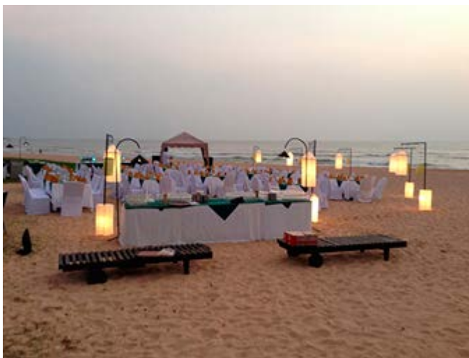
Cena gourmet de marisco en una playa exclusiva