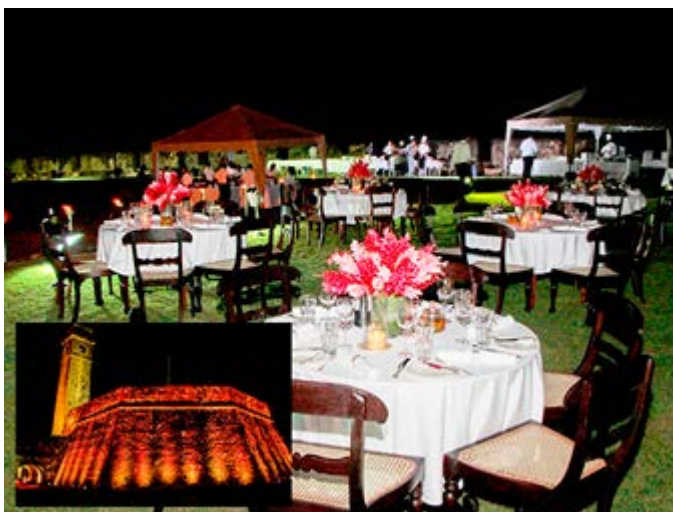
Cena de Gala en las Murallas de Galle