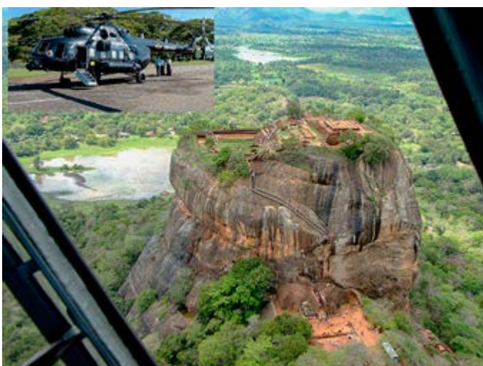
Visita de Sigiriya en Helicóptero