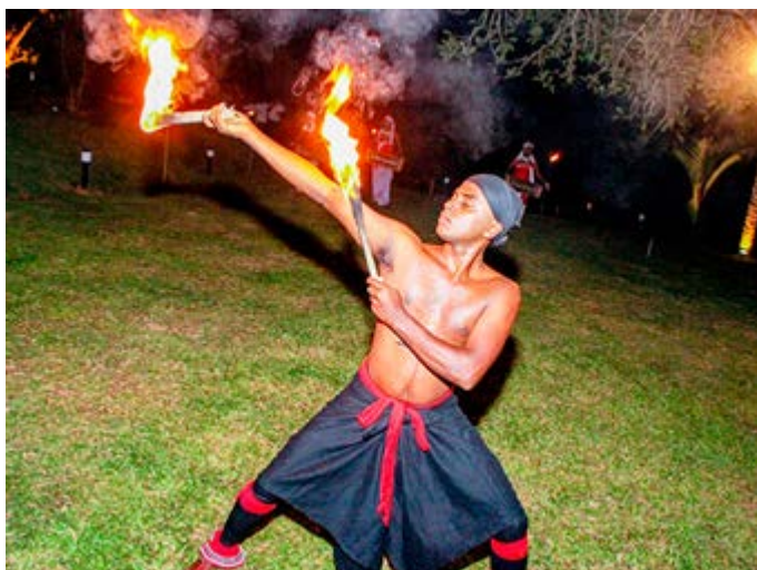
Danza del Fuego Tradicional