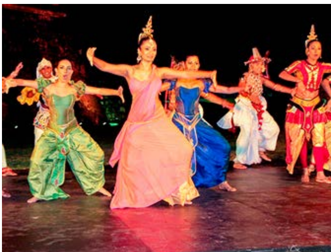
Exclusivo Show Cultural

Para reservar o solicitar una cotización de tu itinerario a medida contacta con: