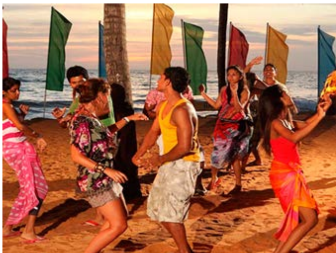
Cena Party en una playa exclusiva