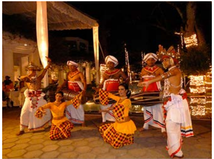
Danzas Kandyan de Bienvenida en el Hotel