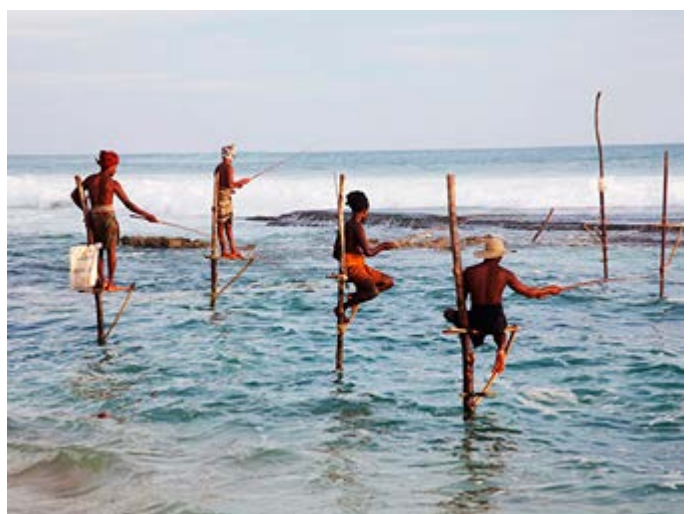
Competición de Pesca con Zanco en la costa sur