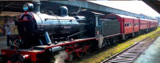
Tren Viceroy a Pinnawela con almuerzo a bordo