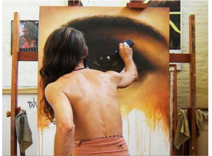
Conozca al artista local Rajhu en Kandy