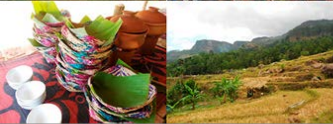
Almuerzo en una Aldea de cultivo de arroz