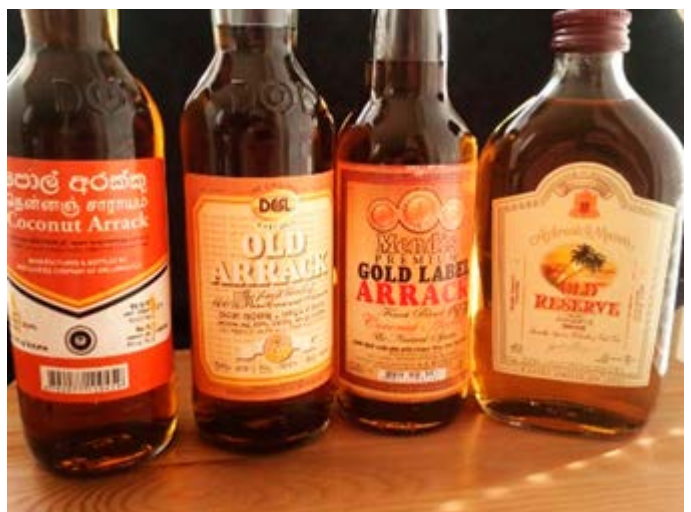
Degustación del Vino Local Arrack