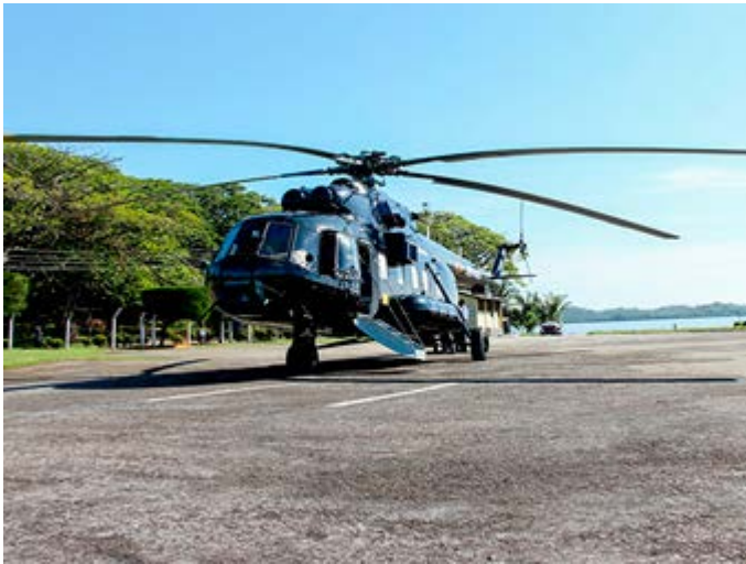
Traslados internos en Helicóptero