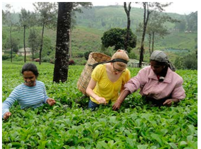
Competición de arrancar hojas frescas de Té