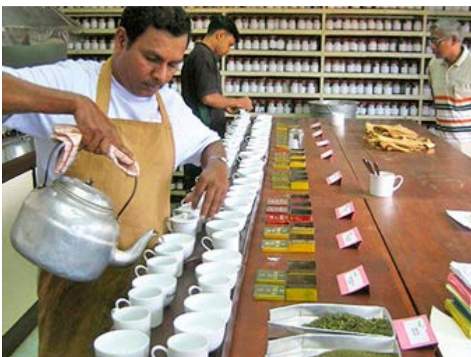
Degustación de Té en una Plantación de Colombo