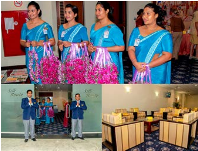
VIP Fast Track a la llegada al Aeropuerto y VIP Lounge

Te ofrecemos auténticas y estimulantes experiencias para que tu viaje sea increíble, emocionante, intrigante, rejuvenecedor y memorable. Actividades para profundizar, entender o interactuar con la verdadera cultura del lugar que está visitando. Algunas experiencias son de acceso exclusivo y privilegiado y representan toda una nueva experiencia para el viajero. Nuestro objetivo es satisfacer y superar las expectativas de tus clientes