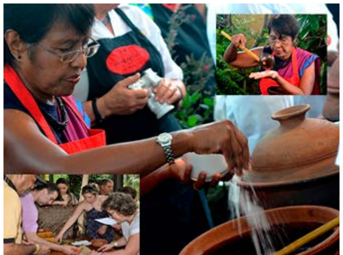
Clases de Cocina con un Master Chef