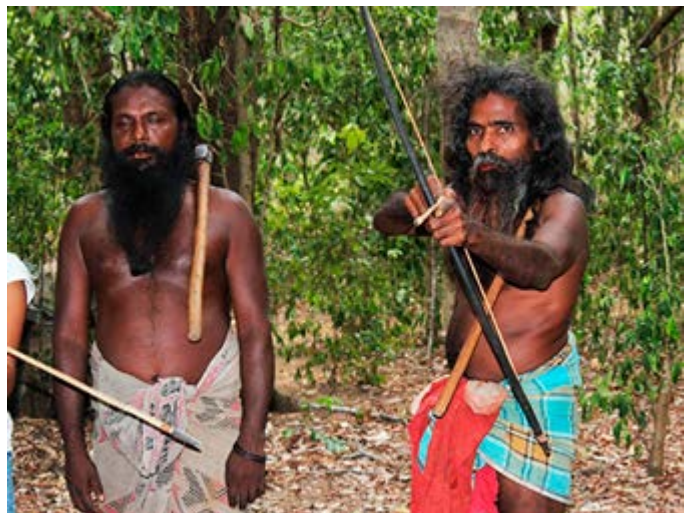
Representación tribal de los indígenas Veddha