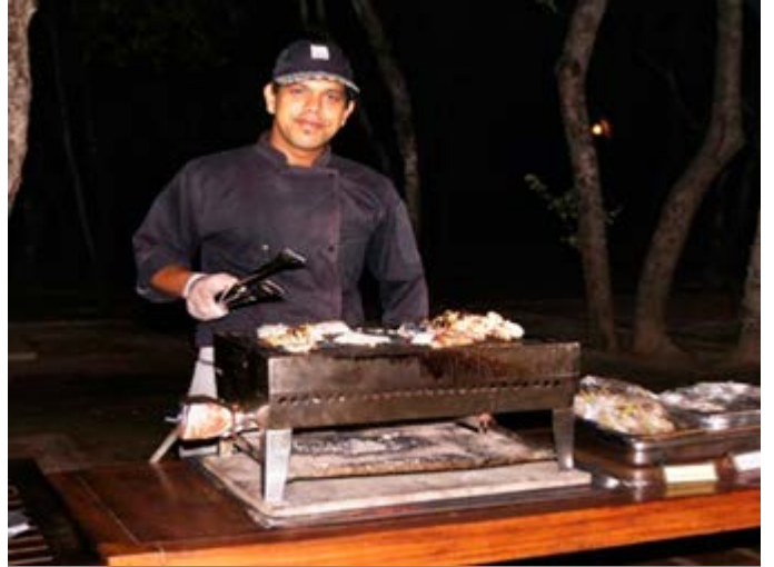
Cena Temática Barbacoa en la Jungla