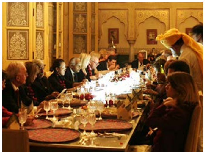
Jaipur -Cena en las estancias privadas del Palacio Real del Maharaja de Jaipur, con cocina tradicional Thali de las cocinas reales