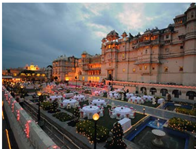
Gran Cena de Gala en el Palacio de la Ciudad de Udaipur