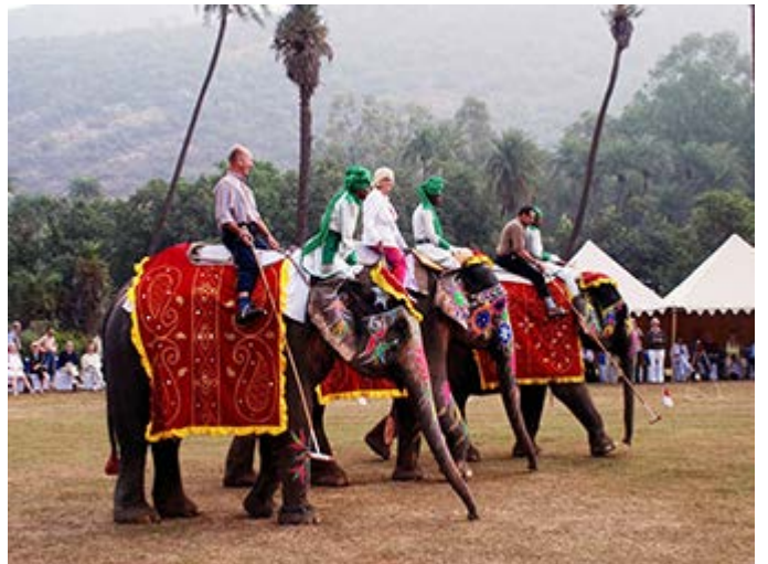
Jaipur - Partido de Polo con Elefantes, con desfile y cena, en los alrededores de Jaipur