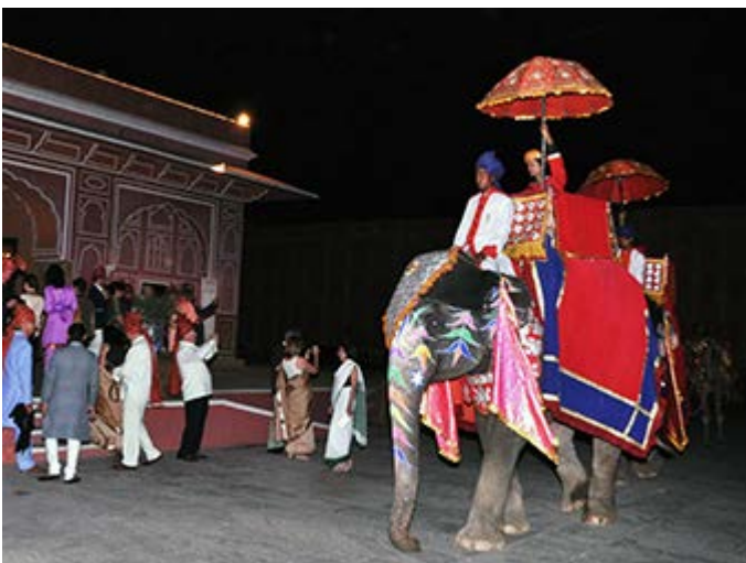
Jaipur - Cena en el Palacio Real del Maharaja de Jaipur con Procesión Real de Bienvenida y visita de estancias privadas