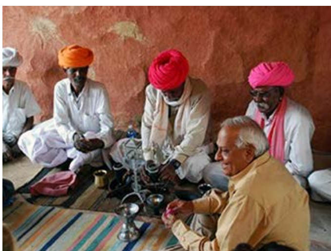
Jodhpur - Safari y visita de las tribus Bishnoi