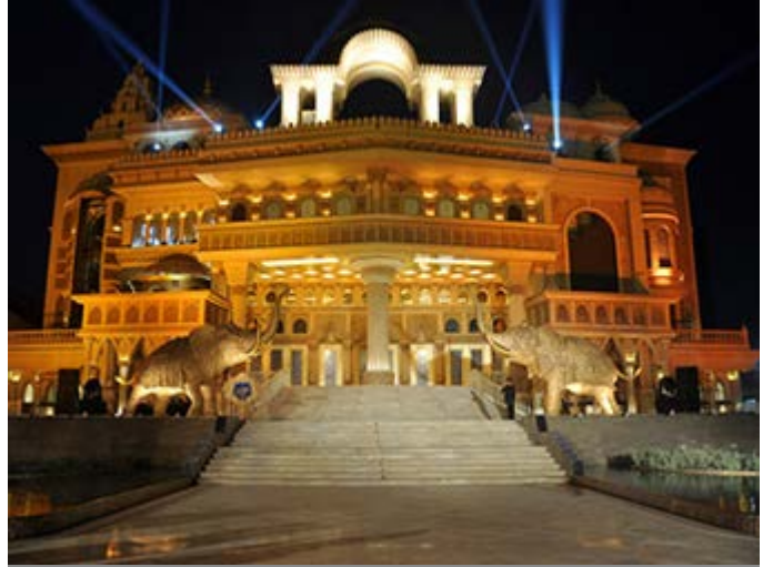
Delhi - Espectáculo de Bollywood en el "Kingdom of Dreams" y cena en el "Culture Gulli" boulevard de la cultura india y su cocina, con bares y actuaciones