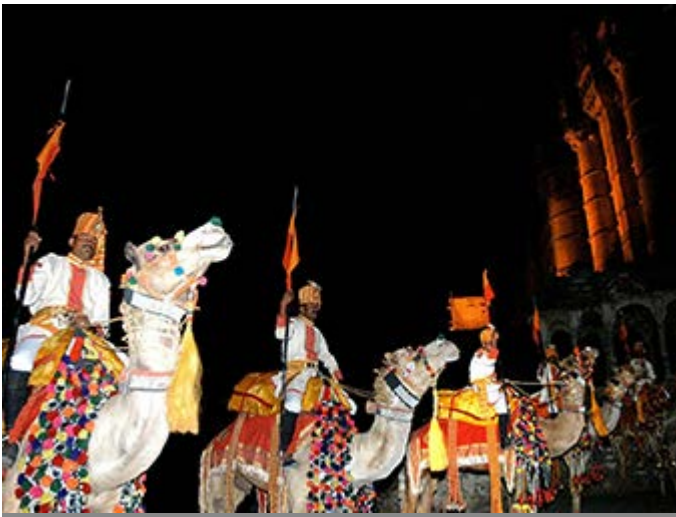
Jodhpur - Cena Real en el Fuerte Mehrangarh