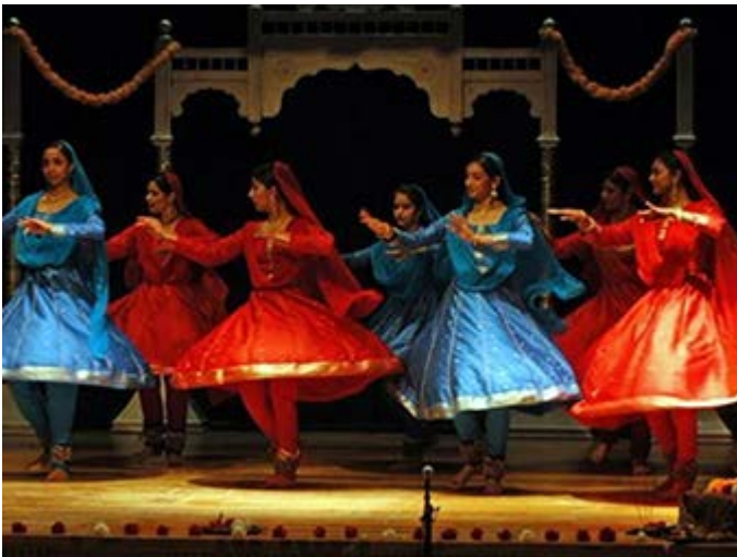
Agra - Cena Mogol - Una velada rememorando la era de los Emperadores Mogoles, con música y danzas