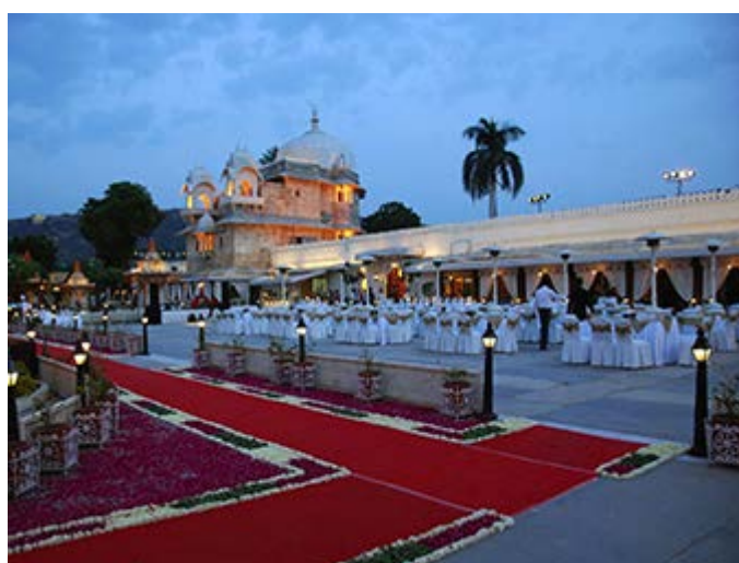
Udaipur - Cena de Gala en la terraza del Palacio de la Isla Jagmandir en el Lago Pichola