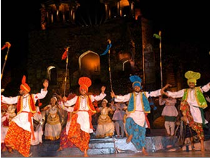
Delhi - Cena recreando un Poblado Indio en los jardines del hotel con muestras de habilidades artesanales y espectáculos con bailarines y cantantes