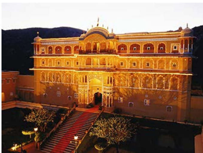
Cena en el Palacio de Samode, cerca de Jaipur