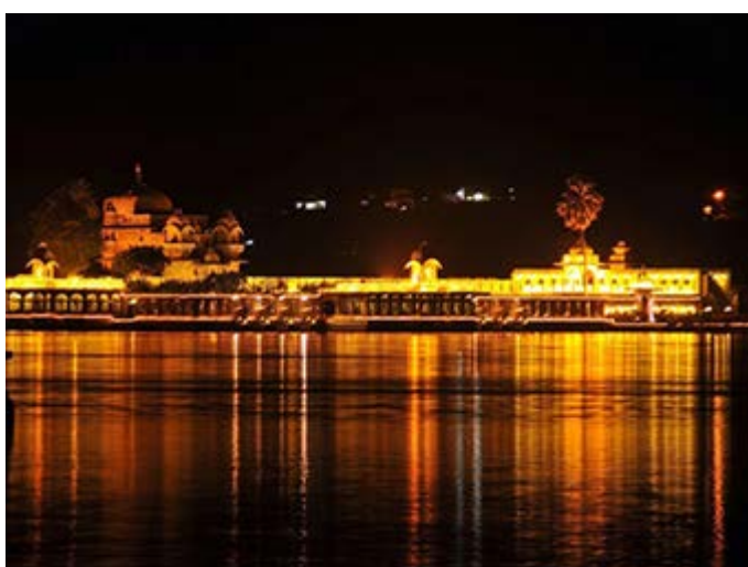
Udaipur - Cena de Gala en la terraza del Palacio de la Isla Jagmandir en el Lago Pichola