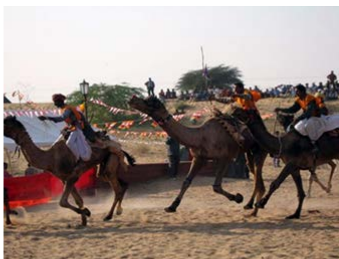
Jodhpur - Carreras de camellos en el Desierto de Osian