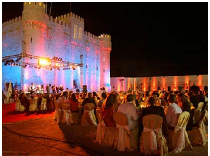
Cena en el Fuerte Qaitbay de Alejandría

Para reservar o solicitar una cotización de tu viaje a medida o de nuestros itinerarios, contacta con: